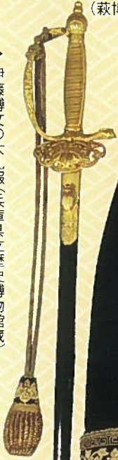
▶ 伊藤博文の大礼服(兵庫県立歴史博物館蔵)