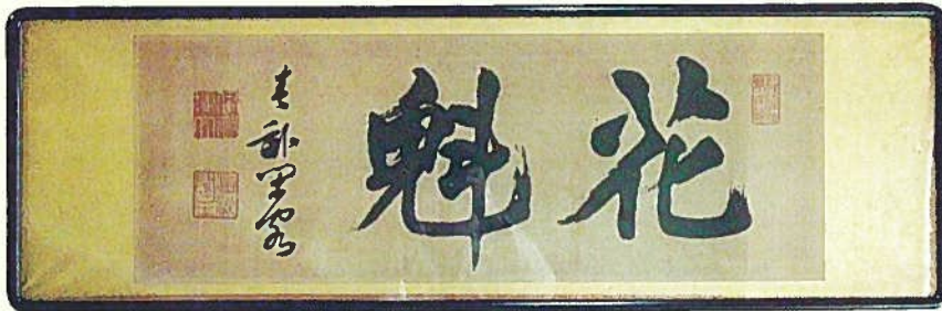
大阪会議ゆかりの地に残る伊藤博文書「花魁」 （花外楼蔵）