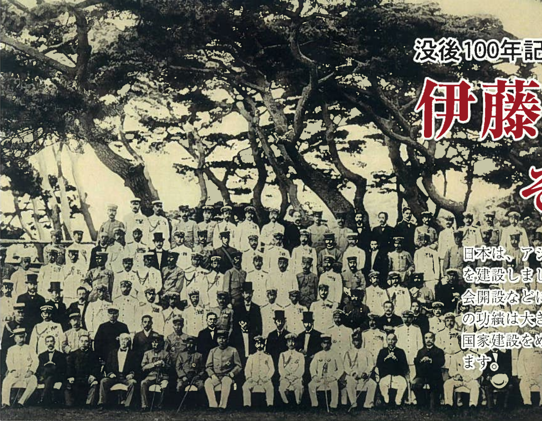
大山巖壮行会に集まった薩長の巨頭たち。前列右から5人目が伊藤博文

日本は、アジアで最初の近代的な立憲制国家を建設しました。その過程で、憲法制定や国会開設などに尽くした初代総理大臣伊藤博文の功績は大きいものがあります。日本の近代国家建設をめざした伊藤博文の軌跡をたどります！