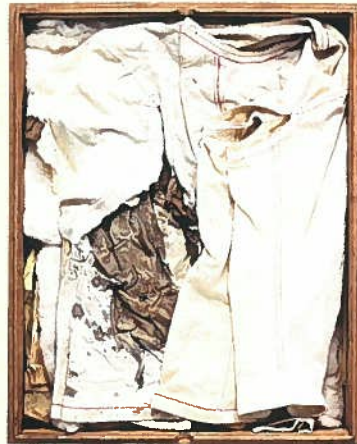
暗殺された時、伊藤博文が着ていたシャツ （山口県立山口博物館蔵）