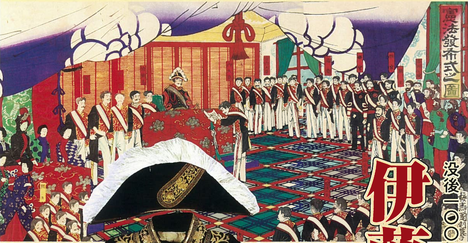
▲ 憲法發布式を描く錦絵 (萩博物館蔵)