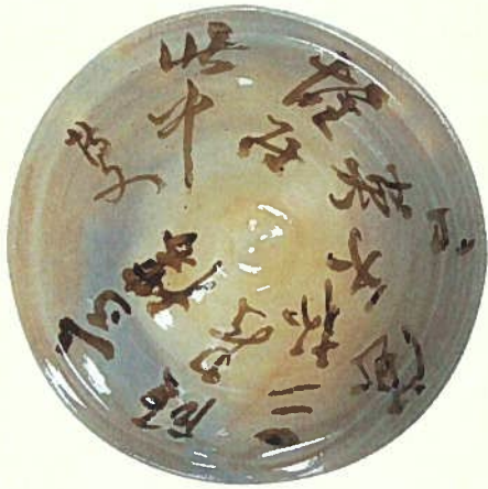
伊藤博文が絵付けした萩焼（松本焼）の盃 （兵庫県公館県政資料館歴史資料部門蔵）