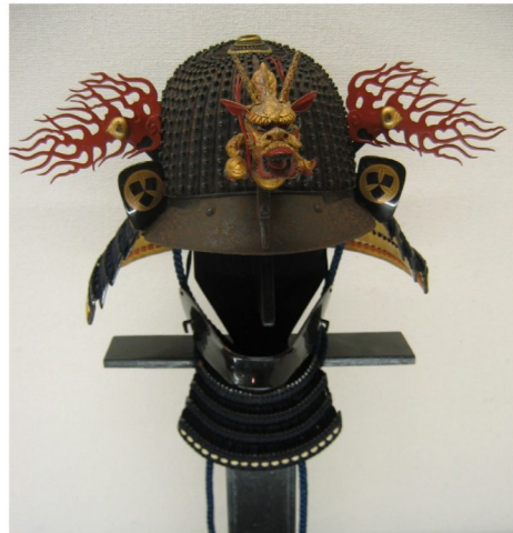
益田氏家紋付火炎龍頭星兜