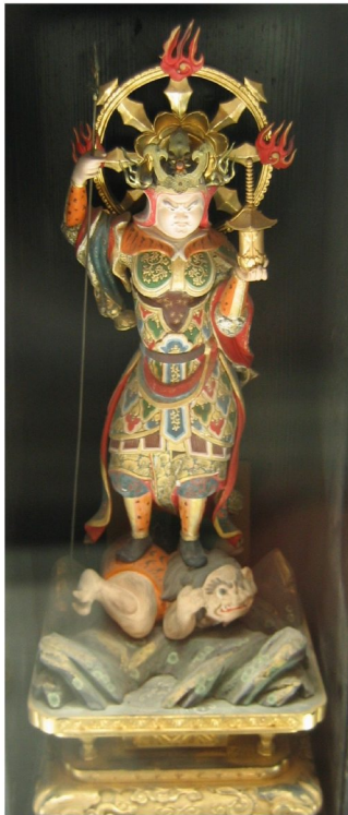
毘沙門天像（益田氏歴代守護神）