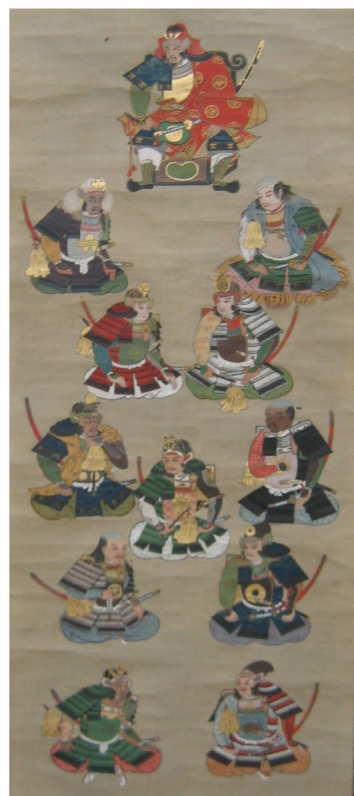
毛利元就御座備図