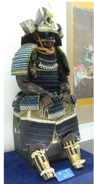
益田氏所用鎧（桃山時代）