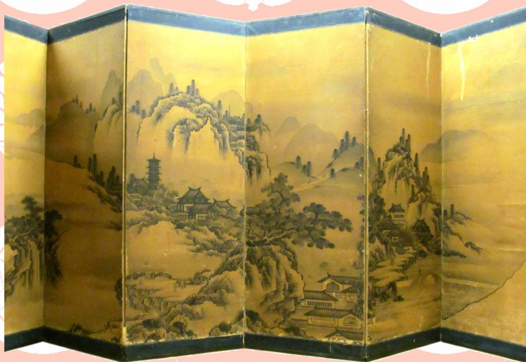
楼閣山水図屏風 永富等運筆