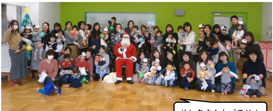
サンタさんとパチリ☆

ママやパパ、おばあちゃんとサンタ作りやプレゼントを煙突に落とすゲームなどを楽しんだよ！最後にはサンタも登場♪