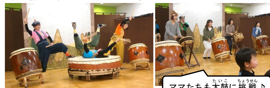
ママたちも太鼓に挑戦♪