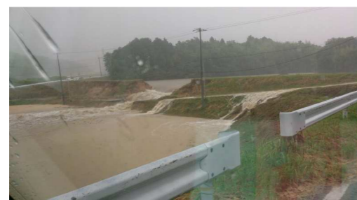
(H25.7.28 豪雨 火打岩ため池決壊)

危険ため池でなくても、古い年代のため池が多く、次第に老朽化していきますので決して安全という訳ではありません。常日頃から異常がないか点検することが大切です。