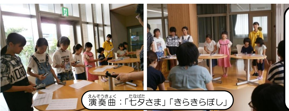
演奏曲：「七夕さま」「きらきらぼし」