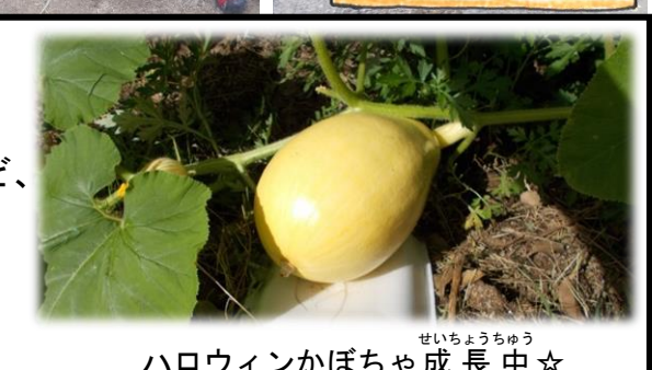
ハロウィンかぼちゃ成長中☆

なあくんのつぶやき 梅雨明け前は晴れる日が少なく、なかなか30℃を超えなかったけど、梅雨明け後は連日34℃近く…。熱中症には気を付けて夏休みを楽しもう！夏休みが終われば、次はキッズフェスタだ！