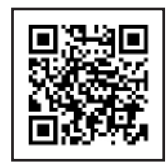
萩市中心商店街等の範囲