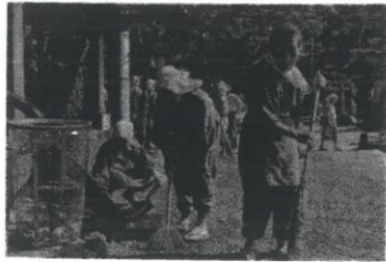
健康増進ときれいな町づくり