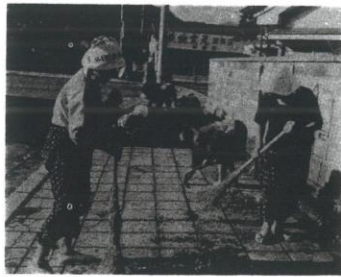
清掃奉仕を始めて6年

参加者も60人以上と出席率もよく、このうち90歳代が10人以上と元気さも一層「空気のきれいな早朝、明神池の周辺から漁港周辺を清掃しています。健康増進に役立ちますよ」と、箒で掃く人草を抜く人、どの顔もみんな楽しそうです。