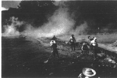
河川五ヶ所で行われた今年初の河川愛護月間。川及び大井海岸、二十日には藍川沿いの清掃が地域ぐるみで行われました。

市内を流れる藍川に見られるように、日常の生活の中川を取り入れ、私たちの生活の場、憩いの場として親しまれ利用されてきた川や海が、近年ごみの不投棄や汚水の排出などによって汚され、その美しさが失われつつあります。 川や海は美しい自然ときれいな水は、私たちが生きてゆくうえにかけがえない財産です。これを大切に保全し、次代へ引き継ぐことは現代に生きる者の大きな努めといえます。