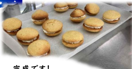
完成です! できあがり。

今回は、オーストラリアとニュージーランドで人気のお菓子、「ジンジャーキス」を作りました。フィリングしたクリームとショウガの香りがある柔らかい生地があって、少し温めるとなお美味しかったです。