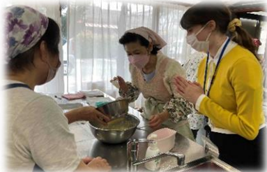
生地が柔らかく、奮闘中