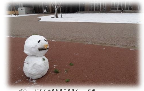
12月24日中央公園に雪だるまが！