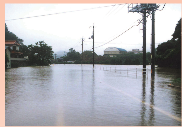
(平成9年7月の台風9号による大井川の洪水)