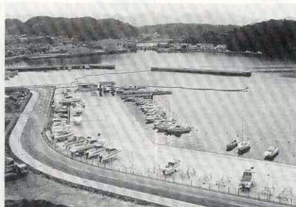
後小畑の潟港に開港したマリリーナ萩

山口県が北浦の自然を生かした長期滞在型の海洋レジャー基地として昭和六十二年度から萩市の後小畑の潟港（がたこう）で進めている萩港地方活性化モデル事業のうち「マリリーナ萩」が昨年七月二十九日に開港しました。管理運営は、萩市と民間企業等で設立した第三セクター「株式会社マリリーナ萩」が行います。昨年八月一日から業務を開始しています。施設面積は八・三ヘクタールで、ヨットやモーターボート約百隻の係留ができます。給油施設やボートを陸揚げする自走式クレーンを備えており、昨年十一月末現在で三十八艇が係留。「近くに素晴らしい海が