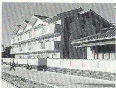
玉江橋たもとに完成した玉江団地

昨年十月に玉江橋のたもとに市営住宅・玉江団地の第一期工事が完成しました。玉江団地は、高齢者向け住宅十五戸、一般住宅十一戸、生活援助員住宅一戸で、高齢者向け住宅の室内には段差がなく、緊急通報システムを導入しています。高齢化社会を迎え、萩市では設備面はもとより緊急時の対応や各種福祉サービスが同時に受けられる高齢者向け住宅の建設を進めています。