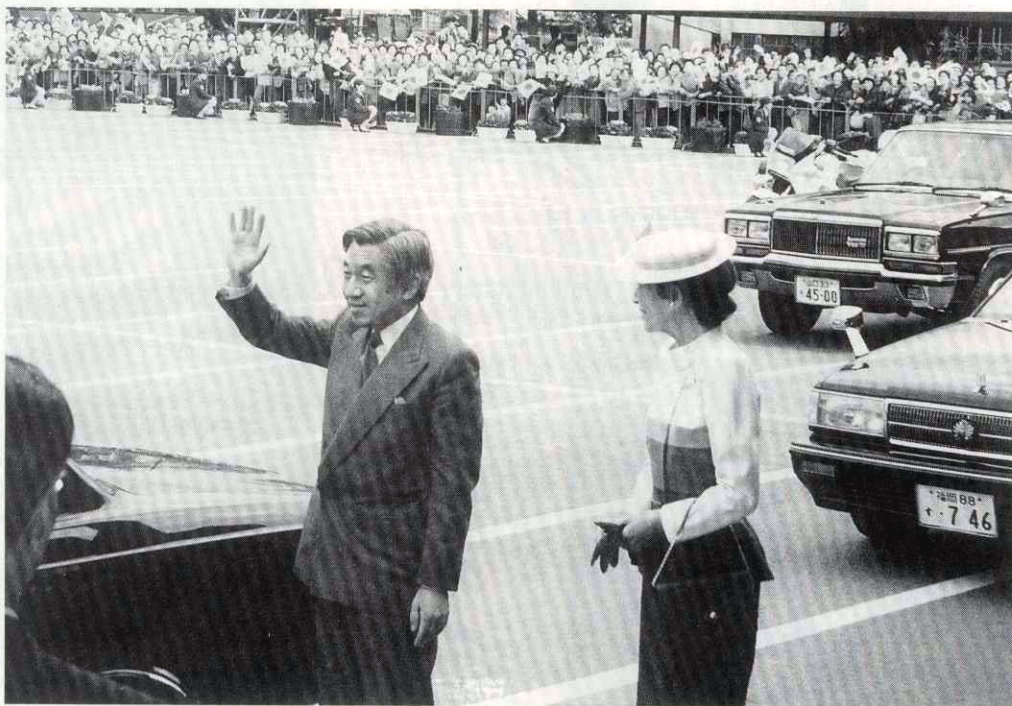
萩市役所で出迎えた市民に笑顔でこたえられる両陛下

長門市の仙崎漁港で昨年十一月二十日に開かれた「第十四回全国豊かな海づくり大会」を前に、天皇・皇后両陛下が、昨年十一月十九日に来萩され松下村塾をご訪問されました。沿道はどことも歓迎の人垣で埋まり、両