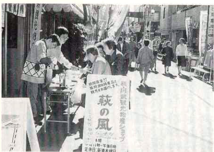
萩・阿武の特産品を販売

萩市や阿武郡の特産品を展示販売する観光物産ショップ「萩の風」が、東京都世田谷区で二月十九日までオープンしています。 「萩の風」は、萩・阿武経済活性化推進会議（事務局・萩商工会議所）が関東地区のニーズを調査するために昨年からの実施。萩焼、かまぼこ、醤油、お菓子、ジャムなどの特産品約百四十種類を販売。営業時間は午前十一時から午後六時までで木曜日はお休み。新年は一月六日から平常通り営業します。 現在「萩の風便りメンバー」