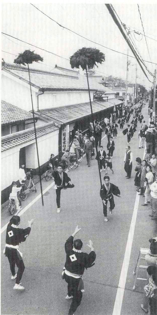
約140人が参加して行われた大名行列

平安古町に古くから伝わる「大名行列」が、昨年も十一月十三日に行われました。約百四十人が、朝八時三十分