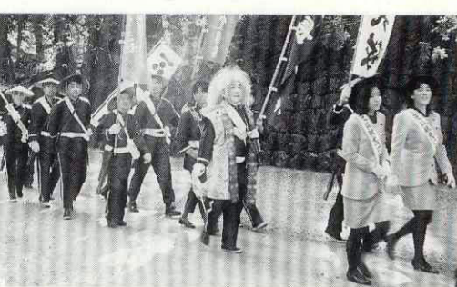
日光東照宮でも萩を宣伝

「子供のころ、夏になるとみなで倉江の浜へ遊びに行き、サザエを採ってツボ焼きにしてよく食べました。今でも海に入ると、なつかしく思い出します。ふるさと萩への思いは、みなさん共通のものではないでしょうか。これからもお役に立ちたいですね。」