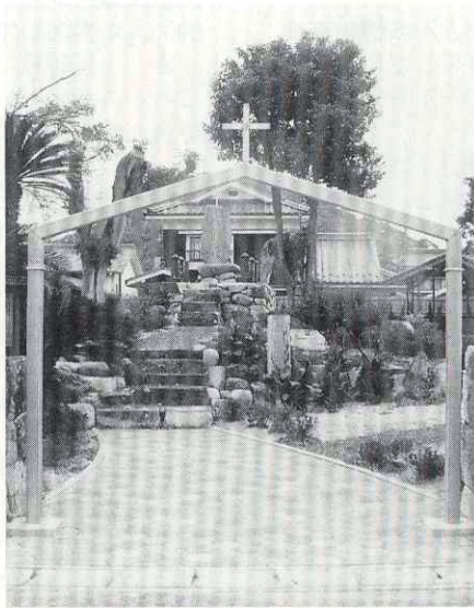
完成した殉教者記念公園

萩キリシタン殉教者記念公園は、このたび墓所の石塚が崩れかけていた萩市堀内の「キリシタン墓地」を半年間かけて整備... 萩市には明治初期のキリスト教の野山獄から江戸に送られ