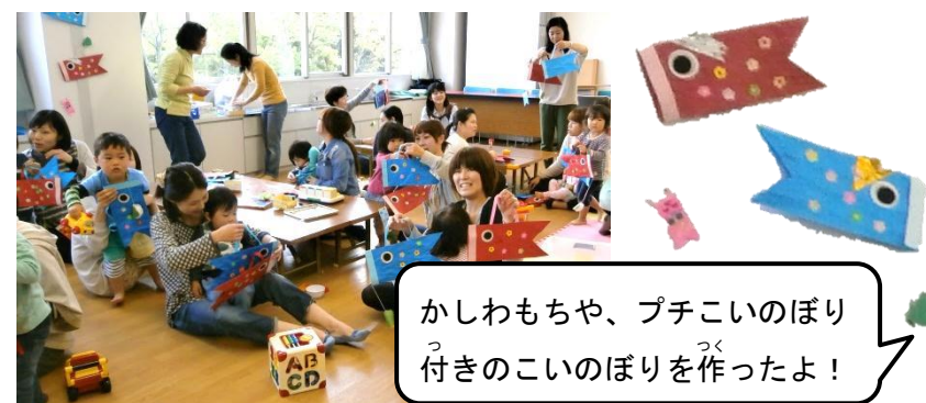
かしわもちや、プチこいのぼり付きのこいのぼりを作ったよ！

5月1日『作って遊ぼう！こいのぼり』 たくさんの方が来られて賑やかに作りました！