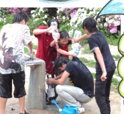
水の戦い！うわっ冷てえ！