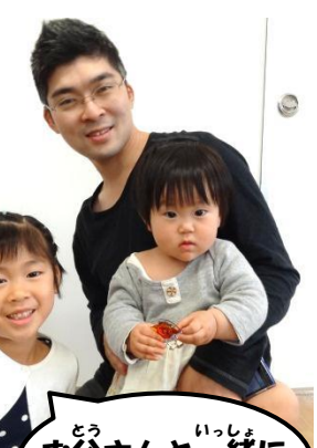
お父さんと一緒に作ったよ！

5月4日～11日『母の日カード作り』 小学生から高校生まで幅広い年代の子たちがカードを作ったよ☆