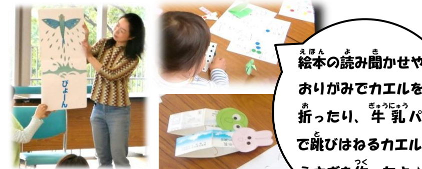
絵本の読み聞かせや おりがみでカエルを折ったり、牛乳パックで跳びはねるカエルやうさぎを作ったよ♪

5月14日『ベビーマッサージ教室』 5組の参加者と一緒にゆったりとした時間を楽しみました♪