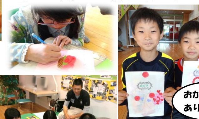
おかあさんありがとう♡

5月4日～11日『母の日カード作り』 小学生から高校生まで幅広い年代の子たちがカードを作ったよ☆