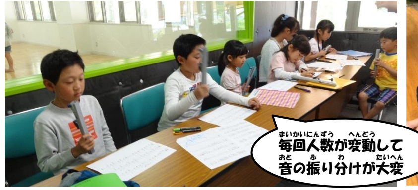
毎回人数が変動して音の振り分けが大変

5月10日『みんなでミュージック』 「ふるさと」に加えて「キラキラ星」を練習したよ♪