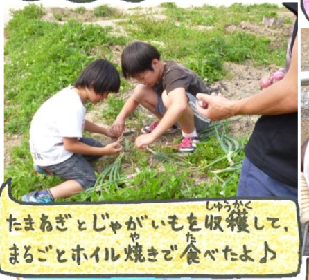
たまねぎとじゃがいもを収穫して、まるごとホイル焼きで食べたよ♪