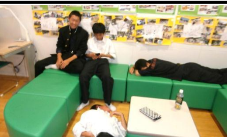
テストしんどーい！（ぐで～）

なあくんのつぶやき 5月中旬は、各高校の試験期間でした。いつもとはちょっと違った雰囲気が、児童館と図書館に漂っていたよ。 いつも館内で遊んでいる小学生も、空気を読んで(?) 1階で遊んでいたのが印象的でした。