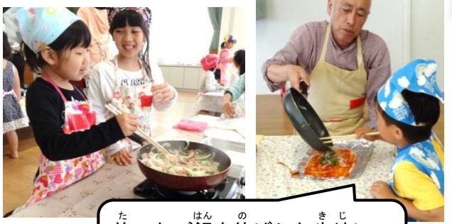
炊いたご飯を伸ばした生地に、いためた野菜とチーズを乗せて…

5月10日『お米deピザ作り』 お米で作った生地で、カリカリもちもちのピザを作って食べたよ！