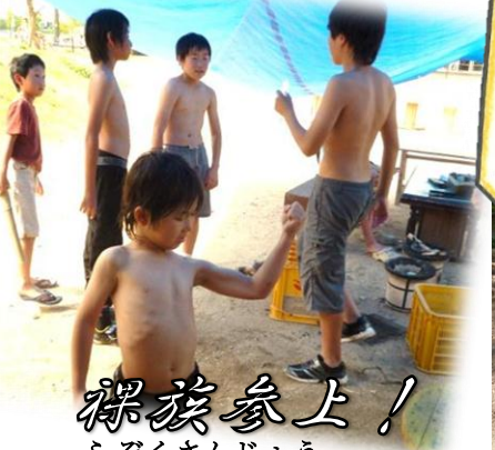
裸猿参上！ らぞくさんじょう

なあくんのつぶやき 5月中旬は、各高校の試験期間でした。いつもとはちょっと違った雰囲気が、児童館と図書館に漂っていたよ。 いつも館内で遊んでいる小学生も、空気を読んで(?) 1階で遊んでいたのが印象的でした。