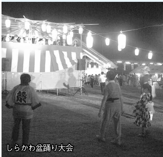
しらかわ盆踊り大会

盆を迎え、白河の領民は盆踊りで死者の霊を慰めますが、長州の隊士も盆踊りに参加し、戦友の霊を慰めたと伝えられています。萩に帰った隊士にとっては、白河踊りを踊ることが戦友への慰霊であったと考えられています。150年近くたった現在でも、萩市の大井、田万川、むつみ、福栄、佐々並をはじめ、県内各地で白河踊りが伝承されています。