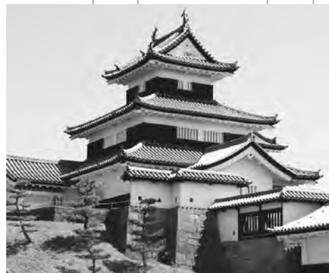
戊辰戦争の激戦地の一つとなつた白河小峰城