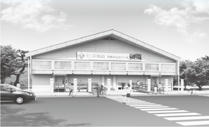
大河ドラマ館 イメージ