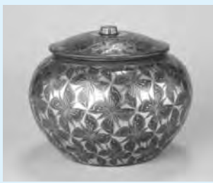
とみもとけんきち 富本憲吉 いろえきんぎんさいしべんかもよう [色絵金銀彩四弁花模様 蓋付飾壺]

日本にはやきものの産地が多くあり、それぞれに特徴のあるやきもの作りが行われ、食のための器だけでなく、茶の湯、華道など日本を代表する伝統文化の形成にも大きな役割を果たしてきました。