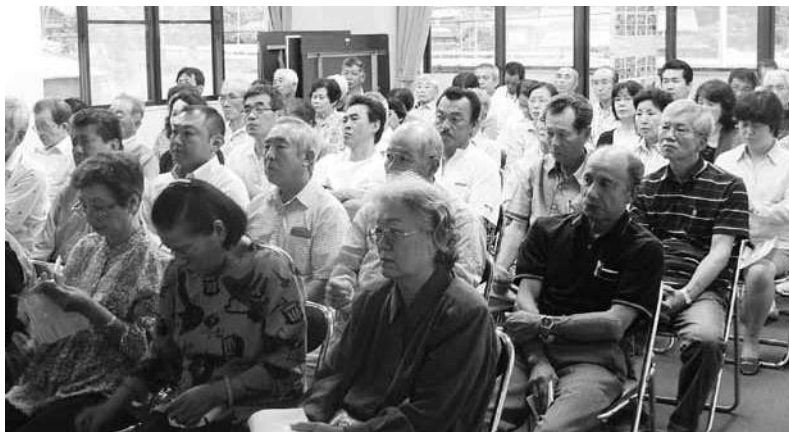
三見小学校区 (7月4日) 三見公民館 78人

性を高めるために、萩から三隅に行く場合、中山から三見市を通って三見駅へ、そして三隅方面へ行くというコースにできないでしょうか。