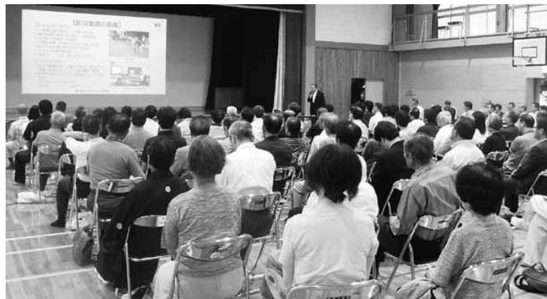
椿東小学校区 (7月1日) 椿東小学校屋内運動場 83人

5月から8月にかけて、萩地域の小学校区で「萩・タウンミーティング」市長との対話の集会を開催しています。