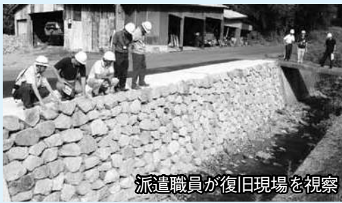
派遣職員が復旧現場を視察

昨年7月28日に萩市東部地域を襲った集中豪雨災害から、1年が経過しました。 市は、この災害の経験や教訓を風化させることなく、自然災害についての防災意識を高めて、市と市民が相互に協力して萩市全体の防災力を向上させるため、7月28日を「萩市民防災の日」とし、昭和58年山陰豪雨の起きた7月23日から29日までの1週間を「萩市民防災週間」とすることを3月に決めました。 今年の防災週間では、式典や講演会で当時を振り返るとともに、関連イベントなども多く開催され、復興への機運を高めました。