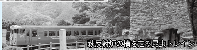
萩反射炉の横を走る昆虫トレイン

萩博物館で開催中の特別展「最強昆虫列伝」に合わせた企画、「昆虫トレインツアー」も復興イベントとして開催。一般公募の44人に加え、被災した育英小、弥富小の児童11人も参加しました。オリジナルのヘッドマークとエンブレムを施した特別列車はJR萩駅を出発、車内イベントや景勝地での低速走行などを行いながら山陰線を走りました。陸上自衛隊むつみ演習場では昆虫観察などを楽しみました。8月23日には須佐コースも開催されます。