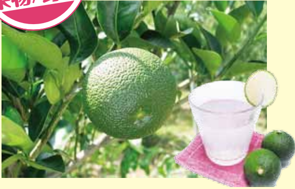
こうきんかんきつ

長門ゆずきちは、田万川地域原産の香酸柑橘として、昭和40年頃から本格的に栽培されている萩市のオリジナル柑橘です。昨年9月には「やまぐちブランド」にも登録されました。