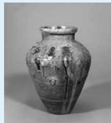
えちぜんさんきんもんこ 越前三筋文壺 平安時代末期(12世紀) 福井県陶芸館

9月9日(火) ～10月13日(月・祝) 上方浮世絵が40年ぶりに大集合します。