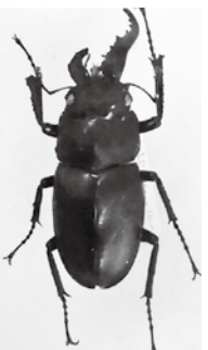
ノコギリクワガタ(山口県初公開)