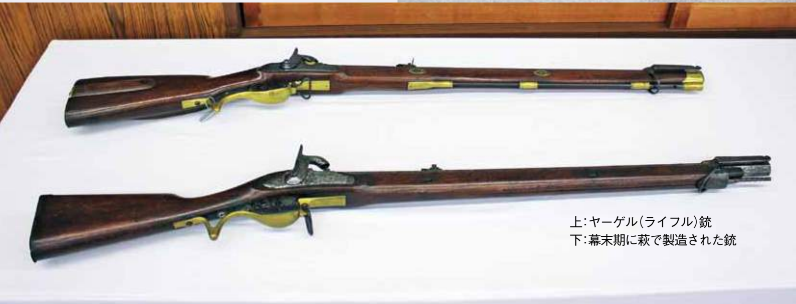
上:ヤーゲル(ライフル)銃 下:幕末期に萩で製造された銃