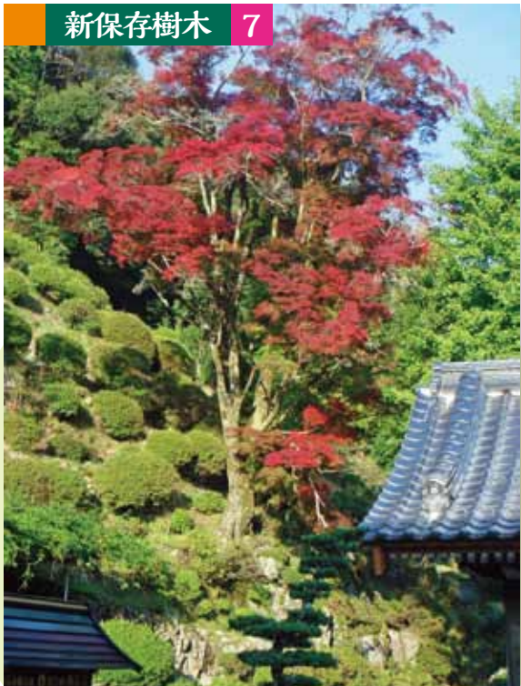
さいがんじ 西岸寺のイロハカエデ (指定No.54)

国道 262 号を山口市方面へ進み、道の駅「あさひ」の手前の交差点を左折し、県道山口福栄須佐線を約 400m 進むと佐々並郵便局がある交差点に着きます。左折し約 50m 進むと西岸寺に到着します。