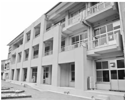
耐震補強が完了した小川小学校

昨年8月、地域の保護者から両小学校の統合について要望書が提出されました。市では、これを受けて住民代表、保護者、学校関係者で構成する福栄地域小学校統合検討委員会を設置し協議を行った