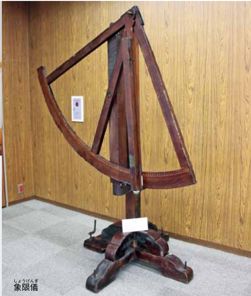
しょうげんぎ 象限儀

顕微鏡 国産の顕微鏡で宝暦時代(1760年位)に製作された。本郷と東京で出来ておりレンズは水晶である。当時の虫等がいっしょに付属品としてついている。