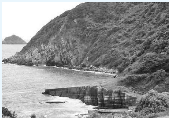
須佐湾・日本列島が誕生したときにできた地層

ついでには、日本ジオパークネットワークに準会員として加盟し、平成28年度の日本ジオパーク認定を目指し取り組んでいきます。