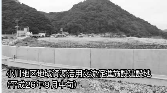
小川地区地域資源活用交流促進施設建設地 (平成26年9月中旬)

被災した小川支所・小川コミュニティセンターを、新たに交流・防災拠点機能を備えた小川地区の復興のシンボルとして整備する、小川地区地域資源活用交流促進施設も9月末から移転新築工事が始まりました。来年の「萩市民防災の日」(7月28日)に竣工し、その日から利用開始の予定です。