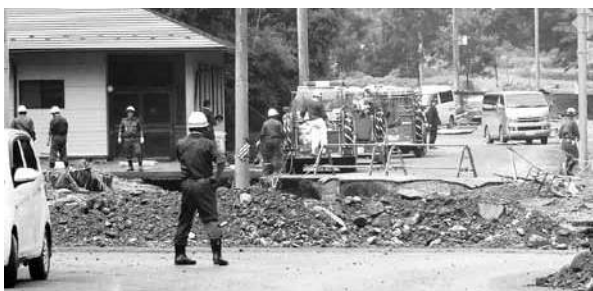
災害現場での消防団員(小川地区、平成25年7月30日)