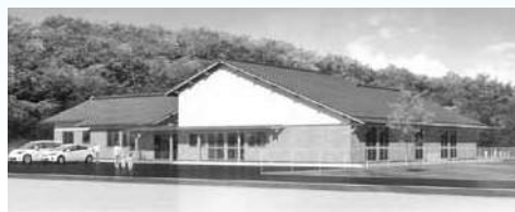
須佐保育園完成予定図