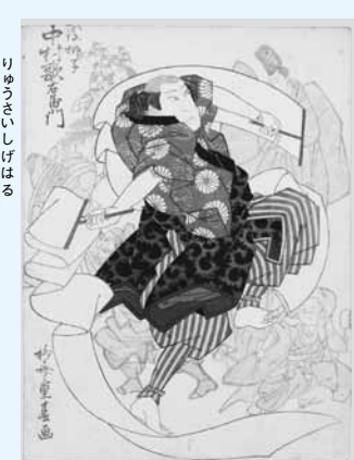
柳斎重春「四代目中村歌右衛門の越後獅子」天保9年(1838) 山村流六世宗家 山村友五郎氏蔵