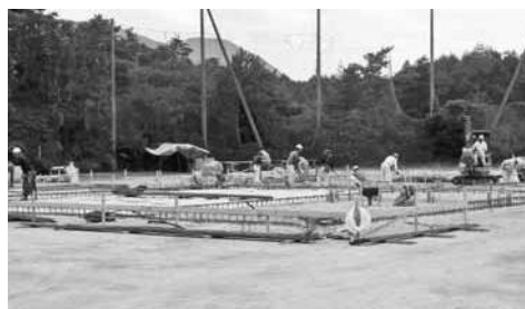
須佐保育園建設地(平成26年9月中旬)

昨年の萩市東部集中豪雨災害で施設全体が被災し、現在は田万川保育園で保育を実施している、須佐保育園の移転新築工事が9月2日から始まりました。