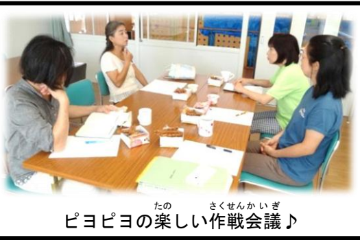
ピヨピヨの楽しい作戦会議♪

なあくんのつぶやき 日増しに秋の深まりが感じられて、体を動かす外遊びが大人気です♪ 運動会の後に、すぐボールを借りに来る子もいて、元気がありあまっている様子(笑) …若いついていいなあ~(*´Д`) =3