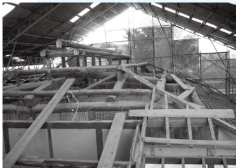
主屋解体中の様子