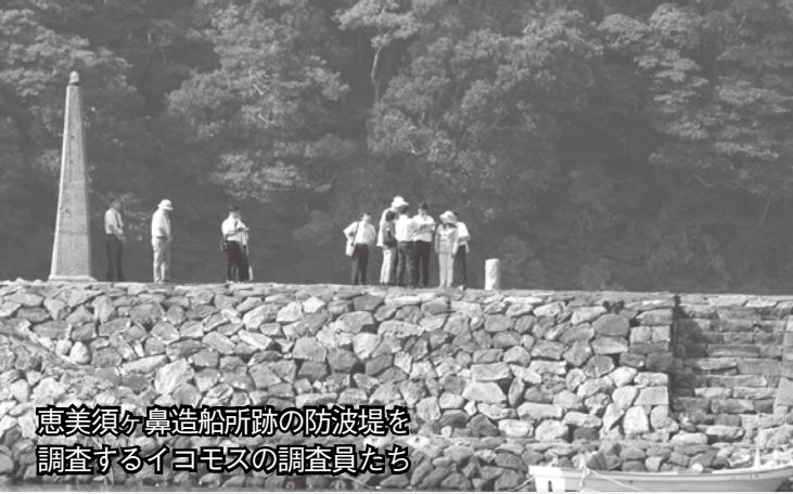
恵美須ヶ鼻造船所跡の防波堤を 調査するイコモスの調査員たち

9月29日、来年の世界文化遺産登録を目指している「明治日本の産業革命遺産 九州・山口と関連地域」の現地調査が萩市で行われました。