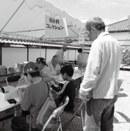
NPO 萩まちじゅう博物館の班活動