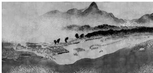
「萩両大川辺・奈古屋島辺之図」(部分) 毛利博物館蔵 絵の具の退色もなく美しい状態で残っています。