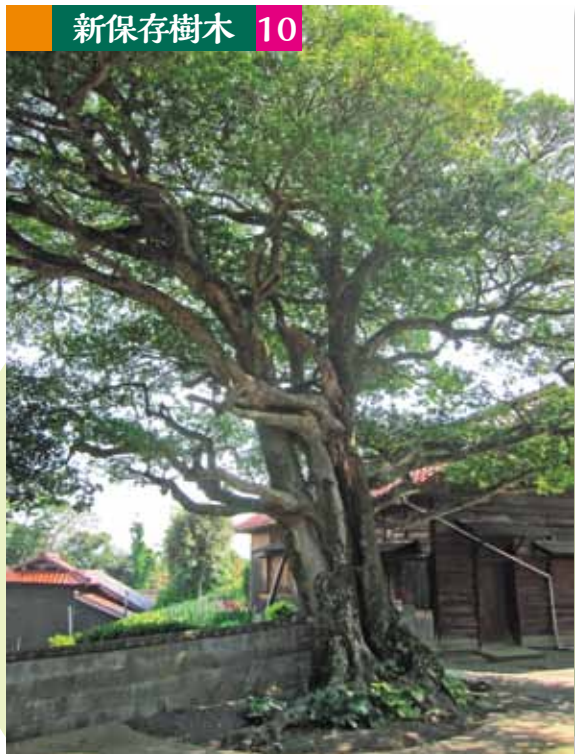
こうさんじ 光讚寺の樹木 (指定No.51)

須佐地区の国道191号から国道315号へ入り約200m進んだ後に左折、市道阿武浦線 あぶうら を約900m進んだ後に右折し、県道須佐湾高山尾浦線 こうやまおうら をホルンフェルス方向へ約1.7km進むと光讚寺へと到着します。