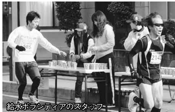
給水ボランティアのスタッフ

萩博物館近くでは、萩西中学校吹奏楽部による演奏が、参加者を元気づけました。 萩ウェルネスパークでは、萩市女性団体連絡協議会による夏みかんジュース、JAあぶらんど萩女性部による萩野菜やむつみ豚を使用した豚汁が振る舞われました。 今大会も、約1000人のボランティアによる給水や交通整理などのほか、多くの市民の皆さんによる沿道での声援により支えられました。ご協力ありがとうございました。