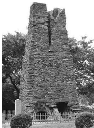
明治日本の産業革命遺産 九州・山口と関連地域の構成資産である「萩反射炉」