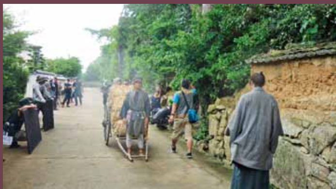
8月10日、萩城城下町でのロケシーン

8月には、菊ヶ浜でエキストラの皆さんも参加して、軍事演習での大砲の射撃シーンの撮影が行われました。第1話で放映されますので、どのようなシーンで登場するか、ぜひお見逃しなく。