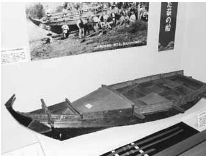
鱻延縄漁船