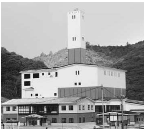
萩・長門清掃工場「はなもゆ」

永年の懸案でありました清掃工場は、山田小原地区の皆さんの理解と協力をいただき建設場所が決まり、建設工事が続いてまいりましたが、昨年