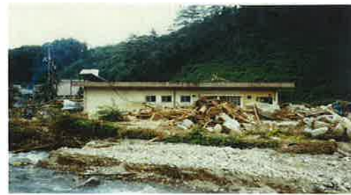
(S60 山口市ため池決壊事例)