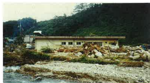
(S60 山口市ため池決壊事例)