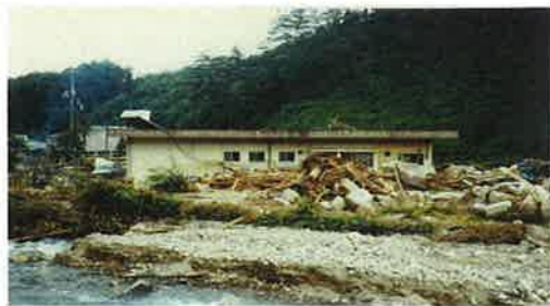
(S60 山口市ため池決壊事例)