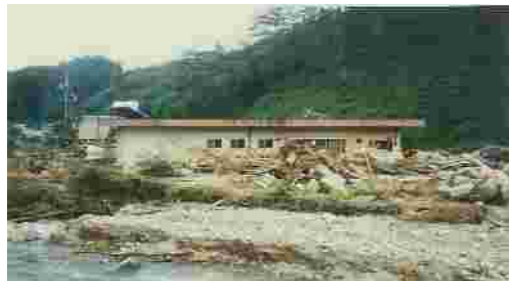
(S60 山口市ため池決壊事例)