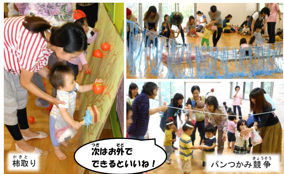
柿取り 次は外でできるといいね!

雨天のため、体力増進室で行いました。体操やかけっこ、スタッフのみなんで考えた内容を楽しんでいたよ♪