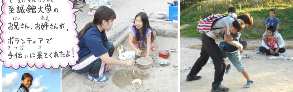
至誠館大学の お兄さん、お姉さんが、 ボランティアで 手伝いに来てくれたよ!