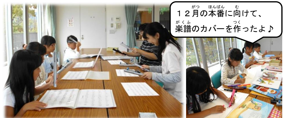
12月の本番に向けて、楽譜のカバーを作ったよ♪