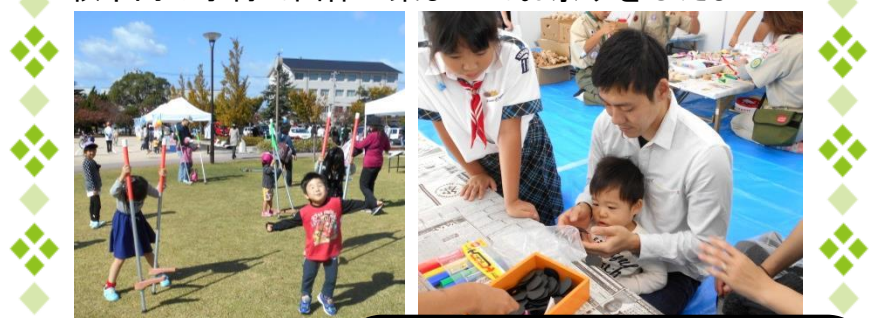
子育て相談 ~相談件数2件~

妊婦さんがお二人相談に来られました。一人目の子どものかかわり方や、本人の体調についてお話をしました。