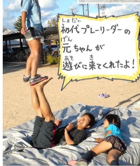
初代プレリーグの 元ちゃんが 遊びに来てくれたよ!