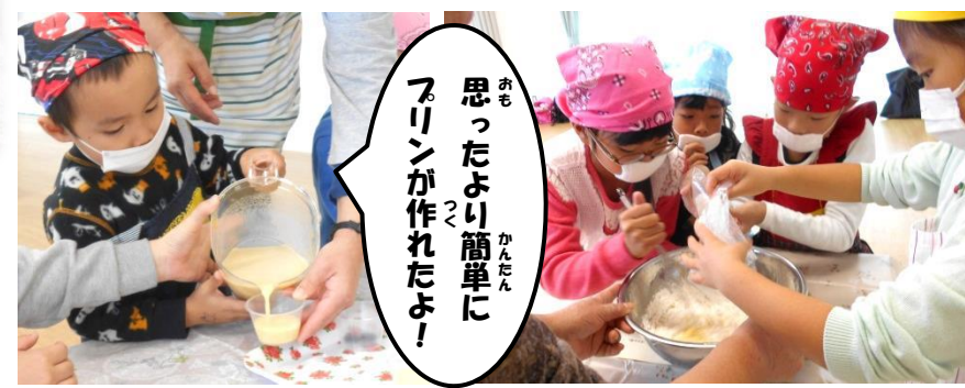
思ったより簡単にプリンが作れたよ!