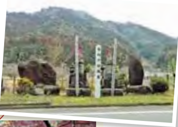
阿武川沿いに建つ二義民の 石碑（背向地蔵）