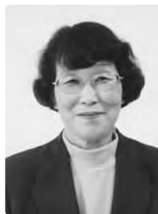
社会福祉功労 (大井保育園保育士)

平成4年から川上診療所長として地域医療の充実に努めるとともに、旧川上村では国民健康保険運営協議会委員として国保運営の適正化に尽力