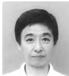
統計調査員表彰 (統計調査員)

平成5年から国勢調査などの各種統計調査員として29回従事。長年の経験から指導員として調査員の育成にも尽力