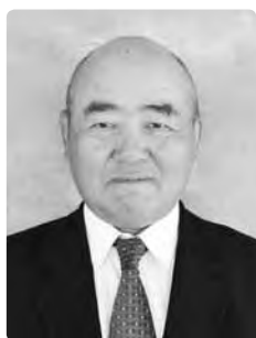
統計調査員表彰 (統計調査員)