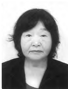
統計調査員表彰 (統計調査員)