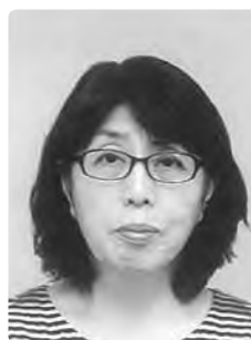
統計調査員表彰 (統計指導員)

昭和60年から農林業センサス調査員として7回従事。統計調査に対する理解と熱意があり、迅速かつ丁寧な調査に尽力