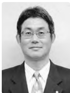
国民健康保険関係者功労 (国民健康保険川上診療所長)