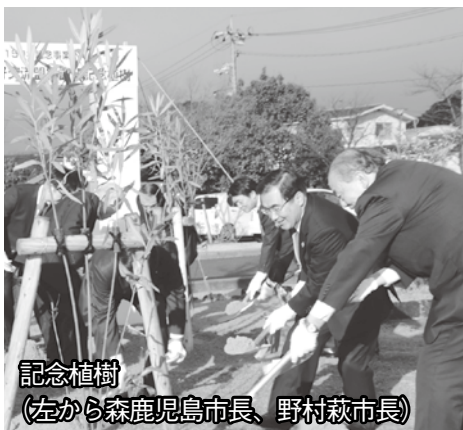
記念植樹 (左から森鹿児島市長、野村萩市長)

1月21日、慶応2年(1866)に締結した薩長同盟から150年となることを記念して、鹿児島市と萩市が友好交流の盟約を締結しました。