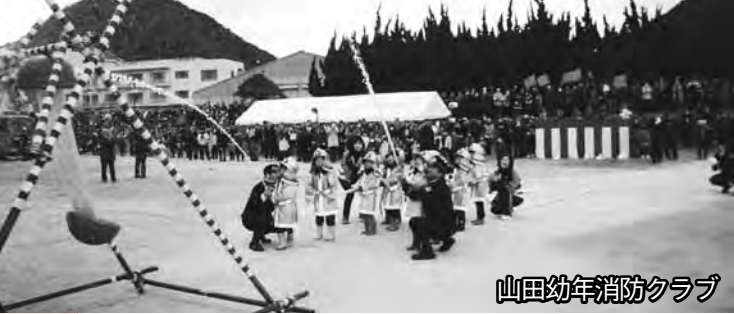
山田幼年消防クラブ