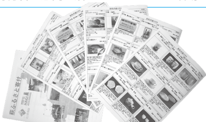
121品目のお礼の品を掲載したパンフレット (時期等により取り扱いのない商品もあります)