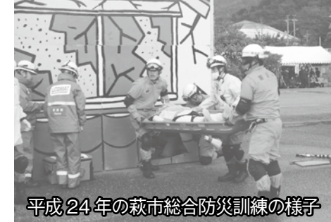
平成24年の萩市総合防災訓練の様子

■ところ 陶芸の村公園(椿東) ■被害想定 ①日本海沖を震源域とするマグニチュード7.5の巨大地震が発生し、最大震度6弱を観測。「大津波警報」が発表されるとともに、最大3mの津波が到達、②前線の影響で、数日前から継続的に雨が降り続く中、「土砂災害警戒情報」、「記録的短時間大雨情報」等が発表されるとともに、大規模土砂災害が発生 ■訓練内容 津波・土砂災害からの住民避難訓練、倒壊家屋や埋没車両等からの救出訓練、ヘリによる救出訓練、ライフライン復旧訓練、避難所運営訓練、災害ボランティアセンター設置訓練、炊き出し訓練など ■訓練時の放送等 当日は、訓練の情報伝達として、消防や警察車両等による広報、防災メール等で情報を配信 ※訓練に参加する消防車等がサイレンを吹鳴する場合がありますので、火災とお間違えのないようご注意ください。 ■展示内容 豪雨体験コーナー、災害復旧車両・通信機器等展示、地震体験車など