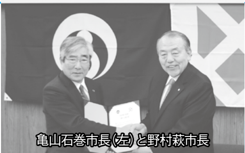
亀山石巻市長(左)と野村萩市長