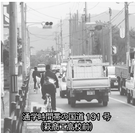
通学時間帯の国道191号(萩商工高校前)

今年度から、片側2車線化とともに右折車線の設置などの交差点の改良や、歩道の拡幅による自転車歩行者道の整備を行うとともに、電線共同溝による地中化の整備も行います。今年度は、調査設計や用地買収な