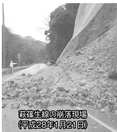
萩篠生線の崩落現場(平成28年1月21日)

今年度は、仮設の防護柵を設置している50mの区間で、不安定な岩等の除去や鉄筋の挿入、コンクリート等による崖面を覆う工事などを行い、秋頃に完了予定です。また、その他の区間については、調査結果に従い必要な対策を行う計画となっています。