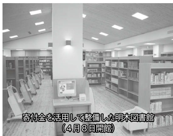
寄付金を活用して整備した明木図書館 （4月8日開館）