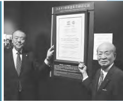
認定証を飾る野村市長(左)と村田昌志萩ユネスコ協会会長