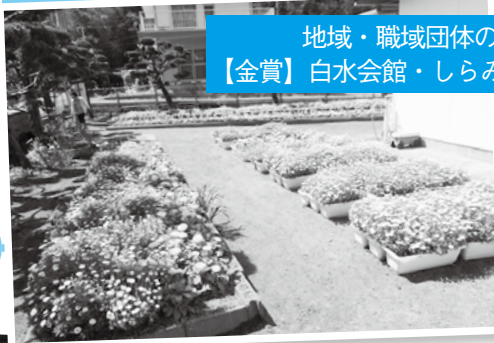
地域・職域団体の部 【金賞】 白水会館・しらみずクラブ

4月13日から15日にかけて萩市花と緑のまちづくり推進協議会が審査し、受賞者が決まりました。