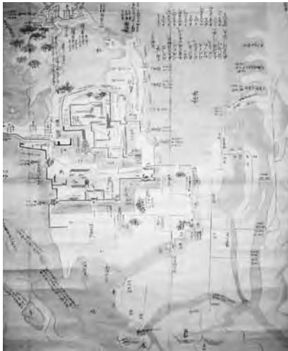
江戸時代初め頃の城下町絵図

後に町人地となる一帯は田島と表記されていますが、既に浜崎は町人地とされており、注目されます。