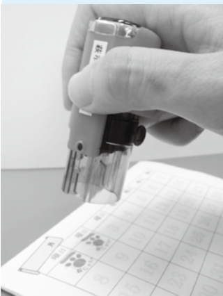
萩にゃん。肉球スタンプ