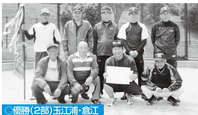
○優勝(2部)玉江浦・倉江