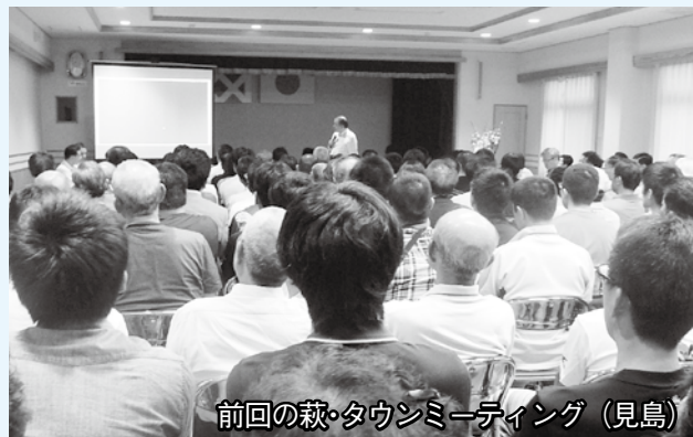
前回の萩・タウンミーティング(見島)