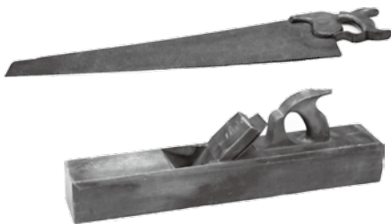
△庸三の使用した「のこぎり」と「かな」