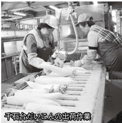
千石台だいこんの出荷作業

現在、エコファーマーの認定を受けた生産者12人が、80haで栽培しており、12月上旬までに県内を中心に、広島、九州へ向け、4000tの出荷、3億円の販売を目指します。