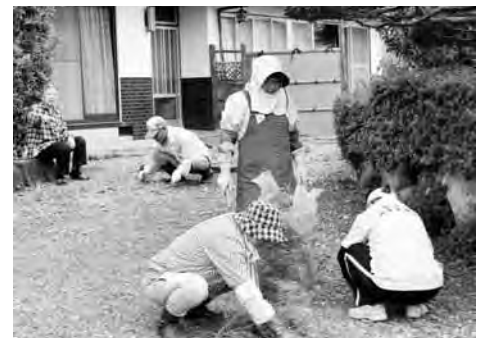
むつみ愛サービス

※通所型サービス・・・レクリエーションなどを行うサロン活動 ※訪問型サービス・・・ゴミ出し、草取りなどの生活援助サービス