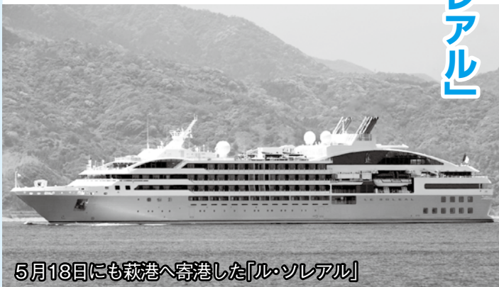
5月18日にも萩港へ寄港した「ル・ソレアル」

クルーズ船は、今年度は7月末までに計8回の寄港を予定。7月4日には、「ばしふいっくびいなす」が寄港します。