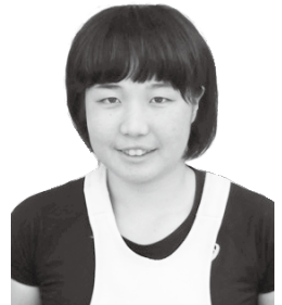
女子チームレースの部 優勝