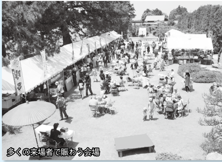
多くの来場者で賑わう会場

会場では、夏みかんや加工品が販売されたほか、夏みかん生搾りジュース体験など多くの方が楽しみました。また、フラワー都市交流物産展も同時に開催され、各都市の特産品が販売されるなど、2日間で約7000人の方で賑わいました。