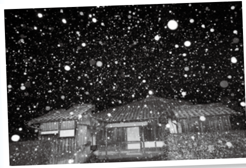
△昨年の最優秀 幽閉の涙雪(大井幸枝、椿)