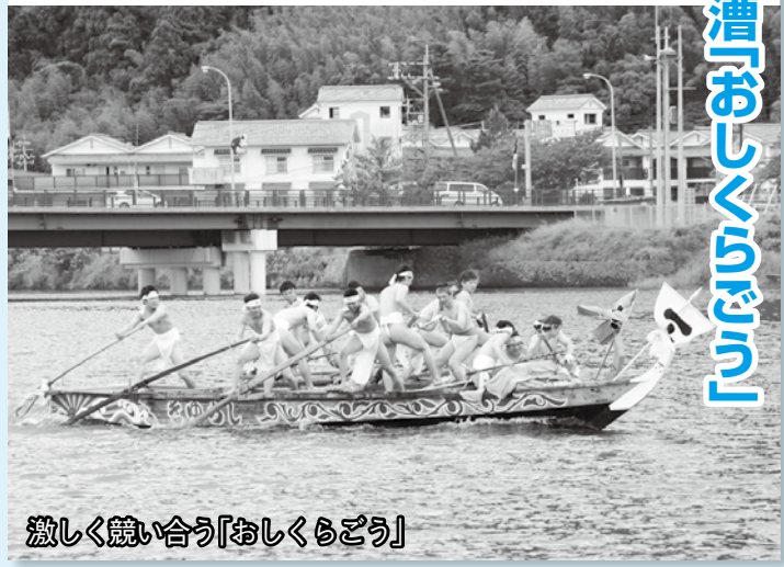
激しく競い合う「おしくらごう」

6月5日、玉江浦地区で藩政時代から受け継がれている伝統の和船競漕「おしくらごう」が開催されました。3隻の船に乗り込んだ鉢巻・下帯姿の7人の若者が、掛け声とともに櫓と櫂を漕ぎ、往復1.2kmの白熱したレースを繰り広げ、玉江浦2区（特攻野郎Bチームエボリユーション）が優勝しました。中学生の部と一般の部の和船競漕も開催され、合計30チームが参加。中学生の部男子は「萩西野球部A」（萩西中）、中学生の部女子は「それいけ！越子ちゃん♡4世・改」越ヶ浜中）、一般の部は「BHO」がそれぞれ優勝しました。