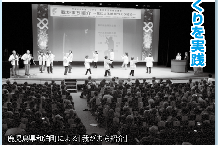
鹿児島県和泊町による「我がまち紹介」

市民館で行われた「我がまち紹介」では、9都市の首長と観光大使などが、シンボルの花を生かしたまちづくりの取り組みについて、ユーモアも交えながら映像とともにアピールし、約400人の参加者は各都市の美しい景色を思い浮かべているようでした。