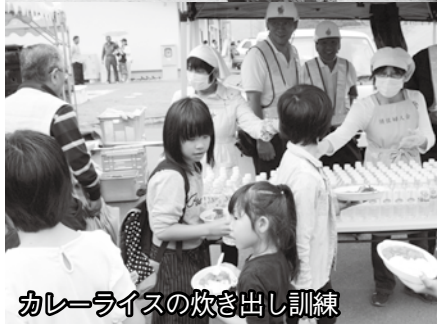
カレーライスの炊き出し訓練