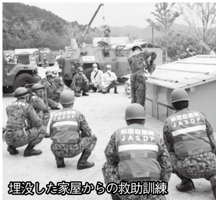
埋没した家屋からの救助訓練

萩市消防本部や自衛隊、県警察などが連携し、事故車両や倒壊家屋からの救出訓練や、参加者全員で地震発生時