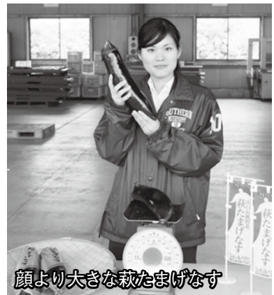
顔より大きな萩たまげなす

7月上旬ごろまでに、県内をはじめ首都圏へ3万本を出荷、1000万円の販売を目指します。