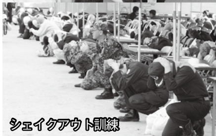
シェイクアウト訓練