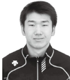
男子チームレースの部 優勝