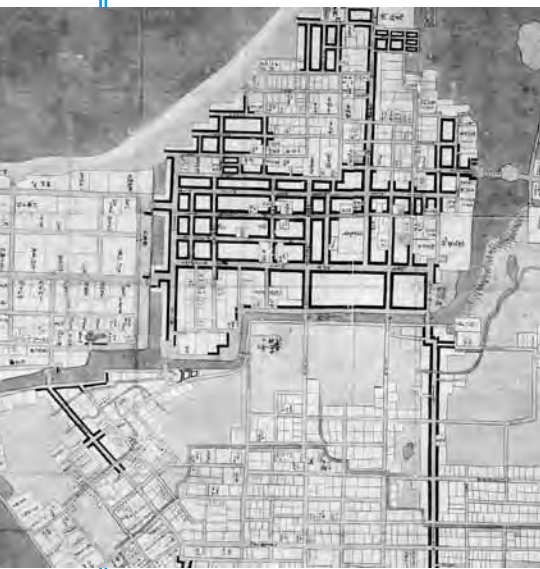
△享保四年(1709)頃の絵図 竣工して間もない頃の新堀川。 三角州を東西に横断し松本川と橋 本川をつないでいる様子がわかる