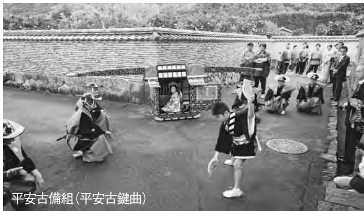
平安古備組(平安古鍵曲)

萩時代まつりのメインとなる「萩大名行列」は、椿の金谷天満宮大祭に、江戸時代から神社に奉納されてきた奉納行列で、古くから萩の人々に親しまれてきました。現在、「平安古備組」と「古萩町大名行列」を合わせて、総勢200人を超える大奉納行列となっています。