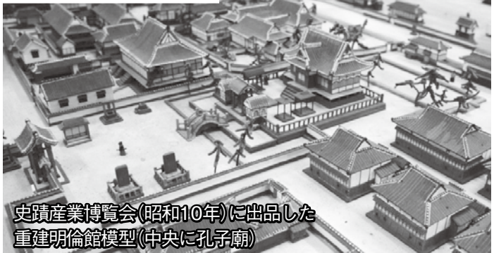
史蹟産業博覧会(昭和10年)に出品した 重建明倫館模型(中央に孔子廟)

萩藩校明倫館は、享保3年(1718)、萩(長州)藩5代藩主毛利吉元が萩城三の丸(堀内)に、藩士の養成を目的に創建しました。 天保8年(1837)、毛利敬親が13代藩主となった当時は、藩財政が破綻していたこともあり、村田清風らに藩政改革を命じるとともに、西欧列強の外圧が高まってきたことから、文武の奨励と人材の登用を掲げました。弘化3年(1846)、敬親は明倫館再建を清風に命じました。が、三の丸の敷地は940坪で拡張の余地がなかったため、江向の地への移転を決定。なお、嘉永元年(1848)、19歳の吉田松陰が藩に上申し