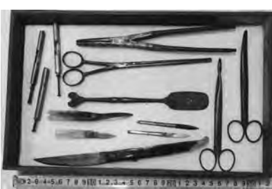
医師が往診の際に使用した治療器具(小川コレクション)