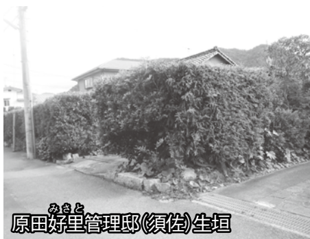
原田好里管理邸(須佐)生垣