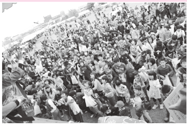
昨年のもちまき(中央公園おまつり広場)