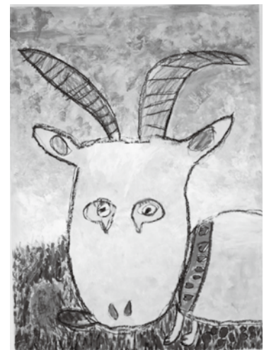
絵画「くさはウメー」

講評／林の中の1本の木が、曲がりくねりながら天に向かって生長する生命力を力強く表現した作品