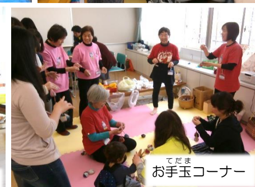
てだま お手玉コーナー