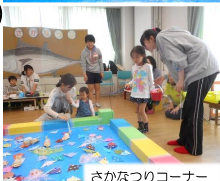
さかなつりコーナー