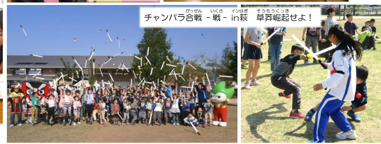
チャンバラ合戦 -戦- in萩 草薙崛起せよ!