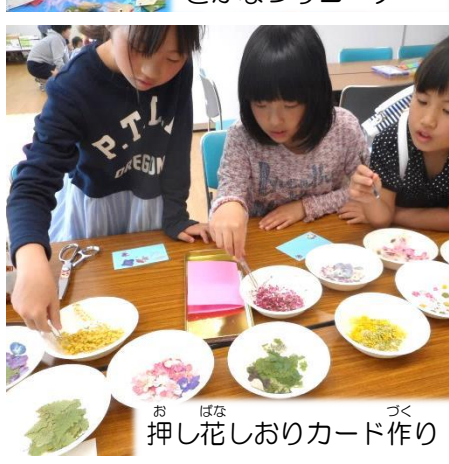
おはな 押し花しおりカード作り