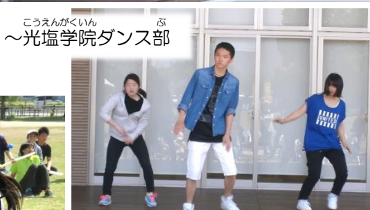
~光塩学院ダンス部