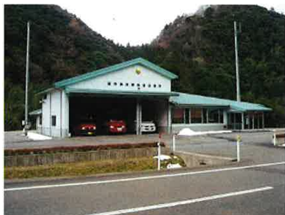
萩市消防署弥富出張所

所在地 萩市大字江向428番地2 建物構造 鉄筋コンクリート造6階建 建築面積 48㎡ 延床面積 288㎡ 建築年月日 平成11年9月30日