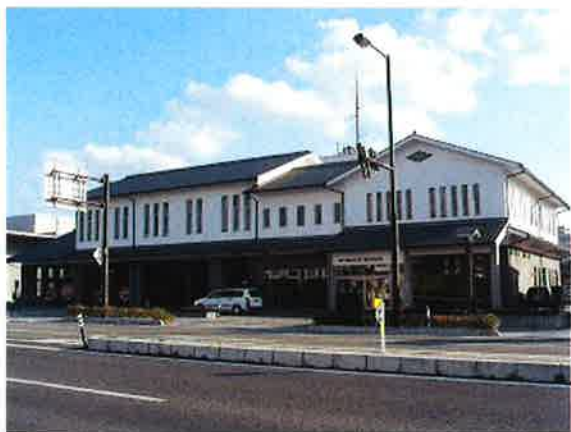
萩市消防本部・消防署