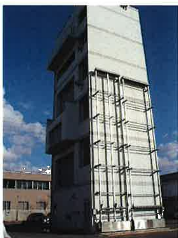
萩市消防署訓練塔

所在地 萩市大字江向428番地2 建物構造 鉄筋コンクリート造2階建 建築面積 1,390.81㎡ 延床面積 2,031.06㎡ 敷地面積 3,754.87㎡ 建築年月日 平成11年9月30日