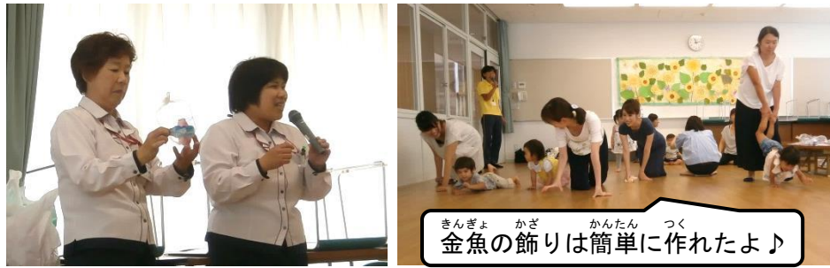
金魚の飾りは簡単に作れたよ♪

ヤクルトの出前講座に来てもらって、容器を使った金魚の飾りを作ったよ！その後ハイハイレースをしたよ♪