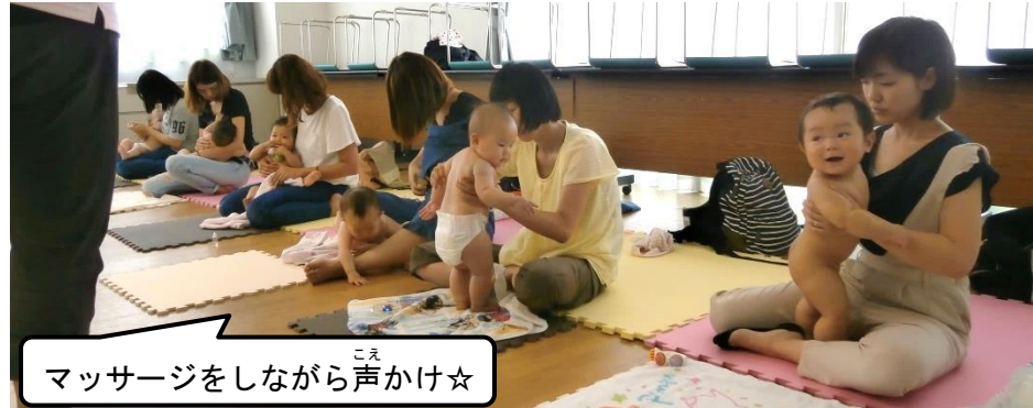
マッサージをしながら声かけ☆