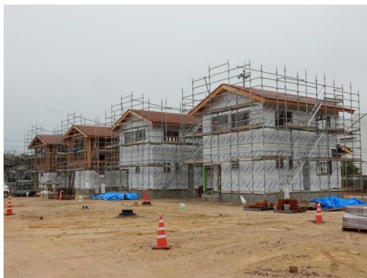
うみかぜ須佐住宅 平成27年11月末