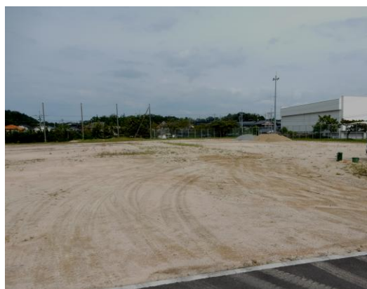
旧奈古高校須佐分校（着工前）