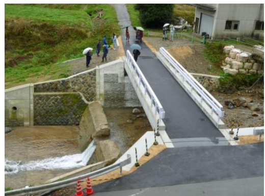
平成27年11月25日の状況