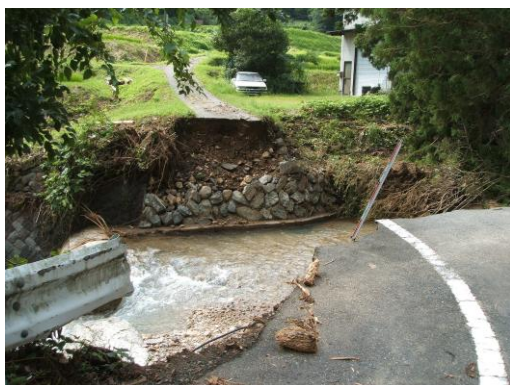
平成25年7月 被災当時

去る11月25日（水）馬取農道橋（須佐地域 鈴野川地区）が通行可能となりました。復旧工事は、土質が大きな転石を含み、隙間が多く著しく崩れやすいなど困難を極めました。地域の皆様のご理解とご協力、関係各位のご尽力により、12月中に完成検査を受け、竣工を迎えます。