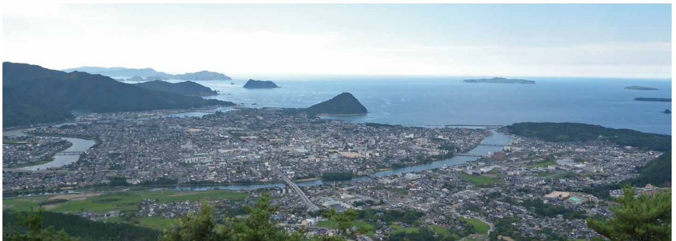
田床山山頂から眺める萩の町

有名ですよ。山頂では阿武川と橋本川に挟まれた三角洲の形がよく見てとれます。天気良ければ、笠山をはじめ、萩六島などの阿武火山群の分布もよく分かります。ゆっくり眺めているだけで、萩のジオを感じることのできる素晴らしい所です。