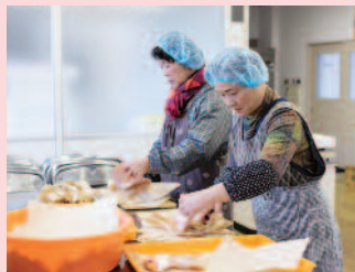
漁協女性部有志グループ 「JF江崎フレッシュかあちゃん」による手仕事

地元・江崎のかあちゃん達が自信を持ってお届けする、山口県知事賞受賞のふっくらジューシー、無添加減塩ひもの。フライパンで蒸し焼きにし、ふっくらと仕上げるのがおすすめ！