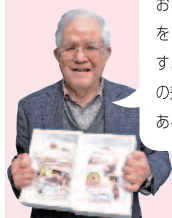
道の駅 うり坊の郷 katamata 下瀬駅長

萩のブランド豚「萩むつみ豚」のおいしさをそのまま包んだ豚まん。エコフィールドで育つ萩むつみ豚は臭みがなくサシと甘みのある肉質。豚まんの餡はネギ塩味で肉まんや冷凍食品には珍しい味です。