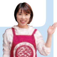
道の駅 萩しーまーと 山口駅長

萩漁港に隣接した道の駅で、萩沖で獲れた新鮮な魚介類を地元価格で購入できます。館内には鮮魚やお土産物店、レストランなど17店舗が軒を連ね、昔懐かしい活気ある公設市場を再現しています。レストランでは新鮮な地魚を使った海鮮料理が食べられます。