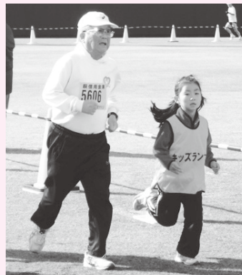
△かわいらしいキッズランナーの声援を受ける選手たち

など、景色が変わって気持ちよく走れました」、「沿道の声援で頑張れました。走った後の爽快感がたまりません」、「フグ鍋は、疲れた体が温まりホッとします」と話してくれました。 沿道からのご声援、ボランティアの皆さん、ご協力ありがとうございました。