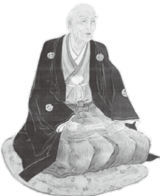
△小幡高政肖像画(萩博物館蔵)

士族の中には、萩に限らず他所でも、明治政府に対して反旗を翻す者もいましたが、大半は、政府や県などが推進する士族授産事業に取り組みます。そのひとつが、小幡高政が山口県就産所からの貸