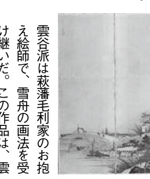
【雲谷派 楼閣山水図屏風】

雲谷派は萩藩毛利家のお抱え絵師で、雪舟の画法を受け継いだ。この作品は、雲谷派初代の雲谷等顔晩年の様式でもって描かれたもので、等顔の弟子たちによる合作の可能性もある。