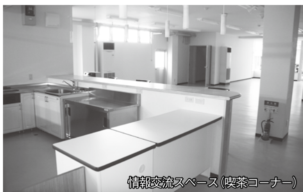
情報交流スペース(喫茶コーナー)

市民活動センターは、平成19年に市に寄贈された建物(旧丸正バザール)を活用したもので、市民活動団体の活動の場や情報発信の場を提供するほか、市民活動に参加したい方と団体との調整や団体間のネットワークづくりのサポートなども行います。