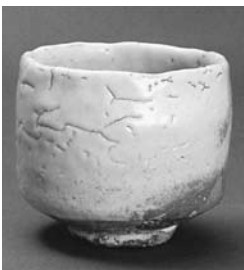
三輪壽雪 萩茶碗 銘 峰紅葉