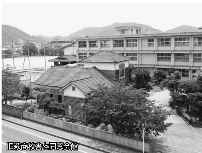
旧萩商校舎と同窓会館