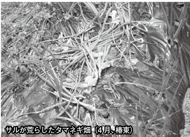
サルが荒らしたタマネギ畑 (4月、椿東)