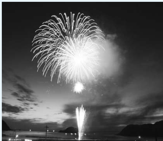
須佐湾大花火大会▷