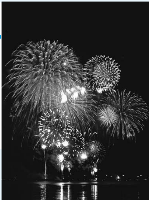
△萩・日本海大花火大会