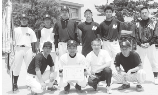
1部優勝 見島チーム(萩地域)

6月28日、明倫小学校で開催され、1部5チーム、2部2チームが出場しました。 【1部】 優勝：見島、準優勝：明木、3位：男命いか（須佐）、福栄 【2部】 優勝：堀内、準優勝：平安古A