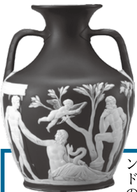
ポートランドの壺<ノースウッド版> 1877年 ウェッジウッド美術館蔵

英国を代表する陶磁器ブランドのウェッジウッドのテイラー・ウエアやデザイナーセットの食器類をはじめ、壺、カメオ、香水瓶など約250点を一堂に紹介します。