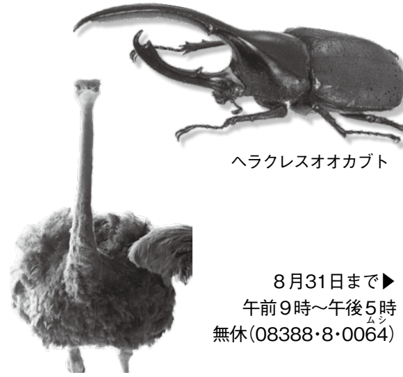
ヘラクレスオオカブト