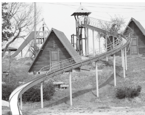
長さ45mもあるジャンボローラー滑り台

むつみのほぼ中央に位置する伏馬 山の頂上にあるこのキャンプ場は、 バンガロー10棟、炊事棟、休憩棟、 テントベースがあり、近くにはジャ ンボローラー滑り台などの遊具が設