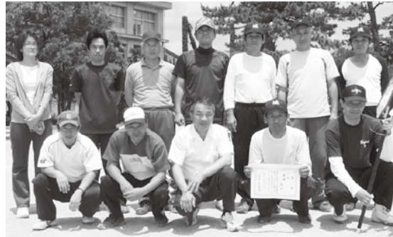
2部優勝 堀内チーム(萩地域)