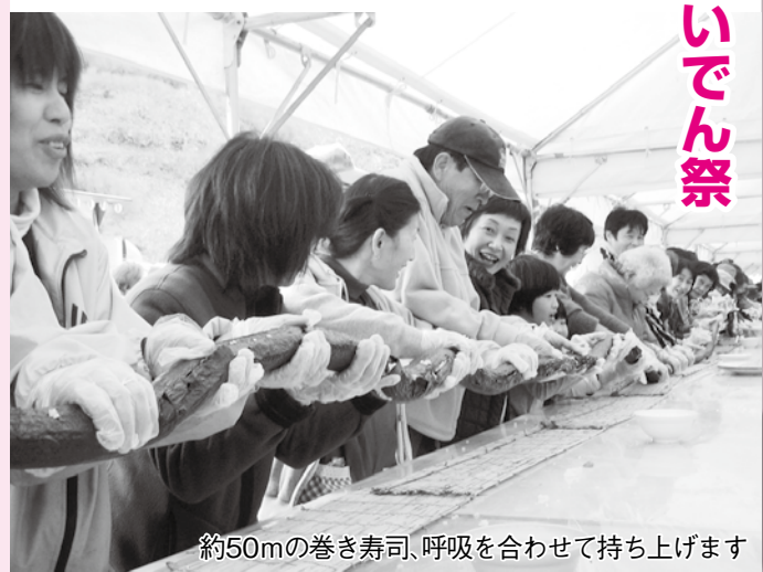
約50mの巻き寿司、呼吸を合わせて持ち上げます

11月15日、「萩往還 ささなみおいでん祭」が旭活性化センター周辺を会場に開催されました。 「わっしょい！わっしょい！」元気なかけ声で子ども御輿が入れ場し、おいでん祭が始まりました。「エコぞうりづくり体験」、「ロング巻寿司大会」など多くのイベントがあり、参加者で賑わいました。祭りの最後には、「まつたけ」「天然うなぎ」「ささなみ米」など、佐々並の味覚が堪能できるお楽しみ大抽選会ともちまきが行われ、来場者は祭りを楽しみました。