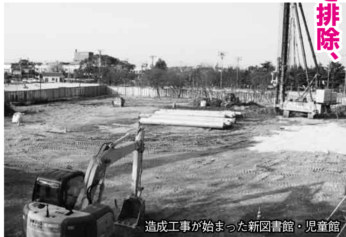
造成工事が始まった新図書館・児童館

両協議会は、公共工事に違法・不法な手段で介入する暴力団等を排除するため、具体的対策を協議・推進し、被害防止と工事の円滑な促進を図るものです。萩建設会館での設立総会では、各協議会会員一同が暴力団等排除への決意表明を行いました。