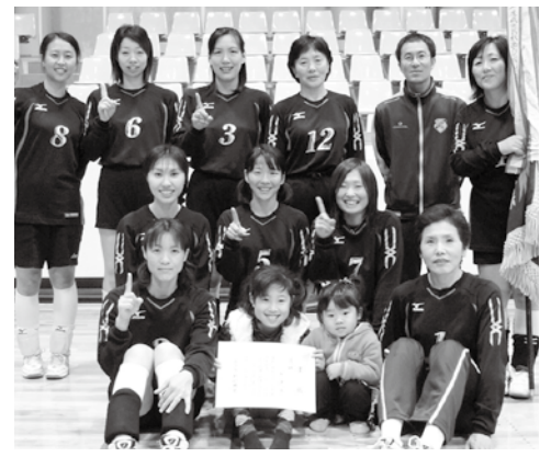
優勝 中津江チーム

11月29日、市民体育館で開催され、9チームが出場しました。 優勝：中津江、準優勝：浜崎、3位：平安古ママさん、つばき