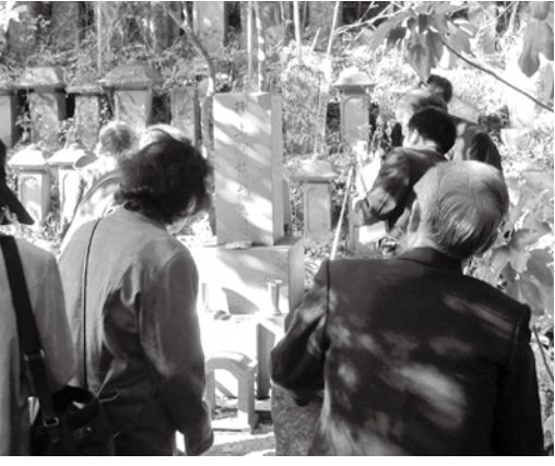
勇壮な彦根城にて(彦根市)