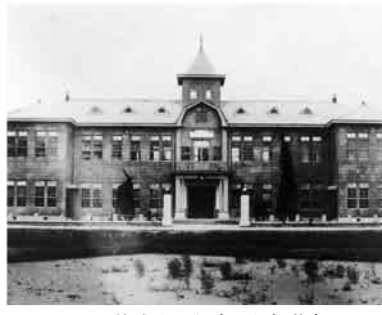
旧萩市役所(昭和初期)