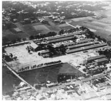
旧藩校明倫館敷地(昭和初期)

元からあった「まち」を壊さない開発ができたことから、萩の「まち」では、江戸時代の城下町絵図を、現在でもそのまま地図として用いることができます。 ▽ギャラリートーク 担当学芸員が展示解説します。 ■とき 12月19日(土)、1月9日(土)、23日(土) 午後2時~(約1時間) ■観覧料 大人500円、高・大学生300円、小・中学生100円 ■駐車場 市民は無料 ■午前9時~午後5時(入館は午後4時30分まで) ※年末年始も無休で開館しています。