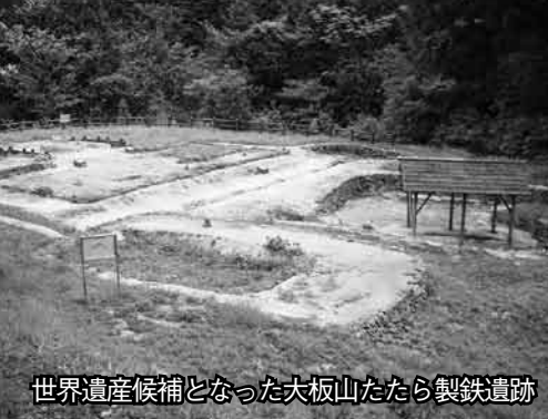
世界遺産候補となった大板山たたら製鉄遺跡