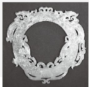
◀双龍文玉環 戦国 直径11cm 沼津市博物館所蔵

休館します。 月1日(金・祝) ※年末年始は12月28日(月)～1月1日(金・祝)