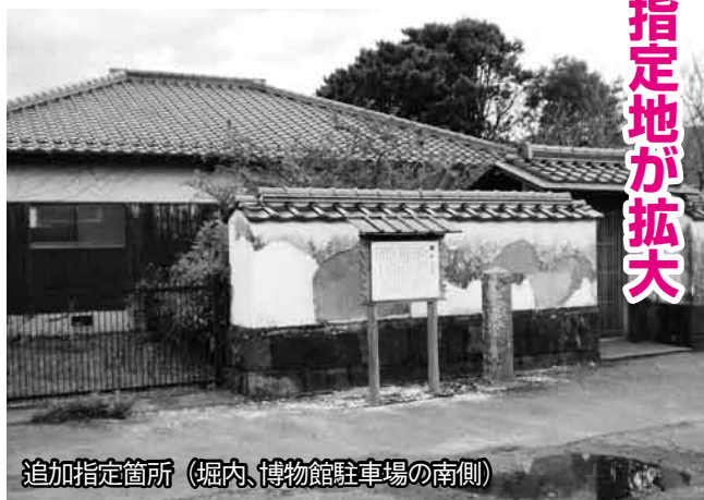
追加指定箇所（堀内、博物館駐車場の南側）