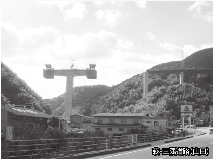
萩・三隅道路(山田)