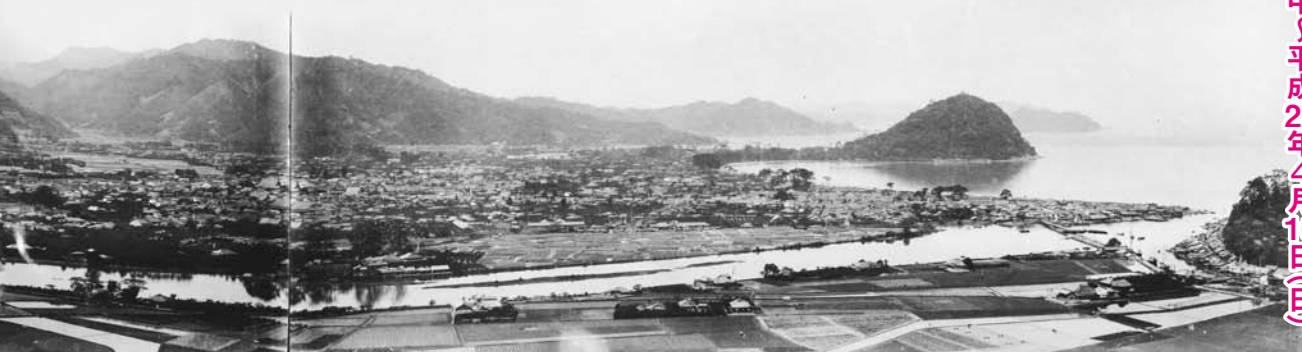
1900年代初めの萩三角州パノラマ写真(1.2m×4.8m)