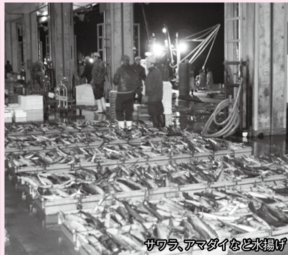
サワラ、アマダイなど水揚げ