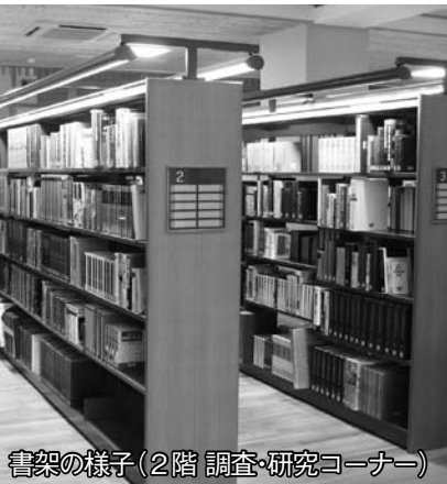
書架の様子(2階 調査・研究コーナー)

今までは書庫に入っていた本も、2階の一般図書コーナーに並べるなど、自由に読むことができる図書が、今までの約8万冊から約14万冊に増大します。