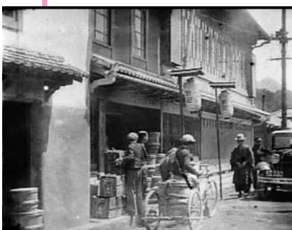
萩史蹟名所紹介映画より「中村酒場」