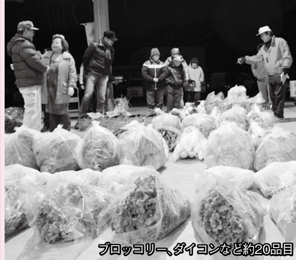
ブロッコリー、ダイコンなど約20品目