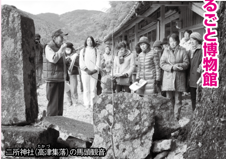
二所神社(高津集落)の馬頭観音

手作りの集落マップを手に、「二所神社やその鳥居の近くに馬の顔が3面に彫られた馬頭観音、お地藏様、県下最大級の大檜、滝などを巡りました。午後からは「ミニ門松作り」、「餅つき」などを地元集落の人と交流しながら体験しました。