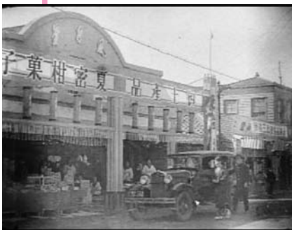
萩史蹟名所紹介映画より「風月堂」