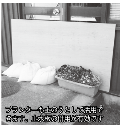
プランターも土のうとして活用できます。止水板の併用が有効です。

降雨中や浸水後の土のう設置は効果がなく、また、膝上以上の浸水は止水板がなければ対応できません。