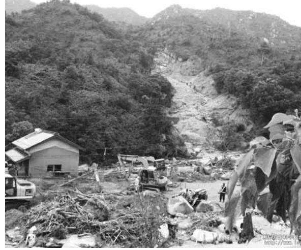
中国・九州北部豪雨による土砂崩れ (平成21年7月、防府市)