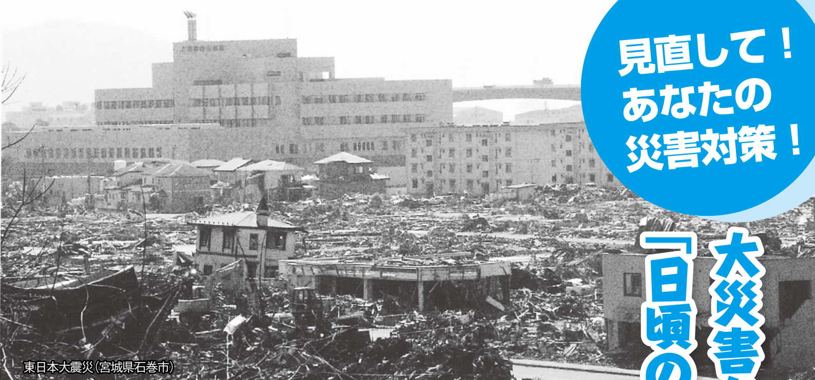
東日本大震災（宮城県石巻市）

関係機関からの情報が間に合わない場合があります。普段から防災情報を収集し、いつでも避難できる準備をお願いします。危険の兆候を感じたら、市の予定避難場所や避難勧告の有無などにこだわらず、直ちに安全な場所に自主避難してください。