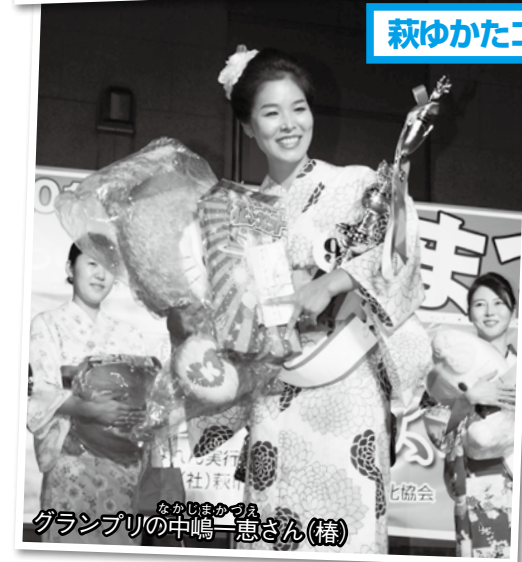
萩ゆかたコレクション