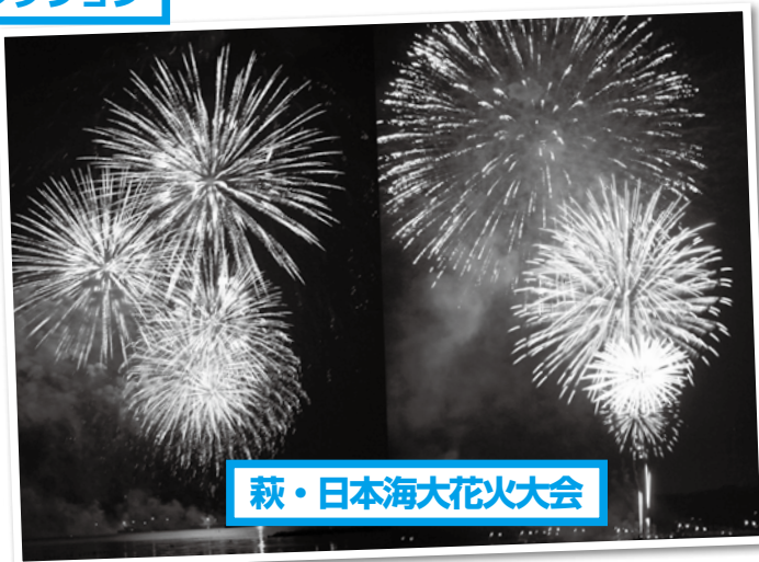
萩・日本海大花火大会