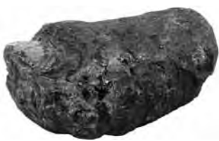
腸にでるかたまり「腸延香」(高砂香料工業蔵) マッコウクジラの腸にでるかたまり