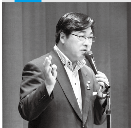
菅家会津若松市長