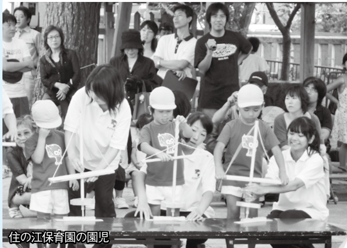
住の江保育園の園児

この日は、住の江保育園の園児が木の棒と板をこすり合わせる「マイギリ式」で一生涯命火をおこしました。