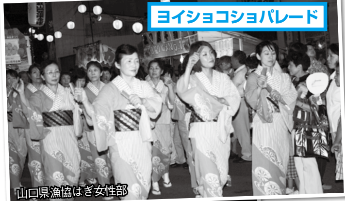
ヨイショコショパレード

2日の市民総踊りでは、夏の暑さにも負けない熱い踊りでまつりを盛り上げ、3日の「萩ゆかたコレクション」では、21人のゆかた美人たちが、まつりに華をそえました。