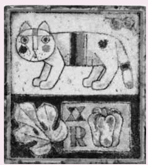
<猫と静物画>1985個人蔵

2月12日(日)まで イタリア・ファエンツァ出身の芸術家、グエツリノ・トラモンテイ(1915・1992)の日本で初めての本格的な回顧展です。 ■観覧料 一般1000円、70歳以上・学生800円 ◆「おいでませ!山口国体」天皇杯・皇后杯の一般公開 10月に行われた「おいでませ!山口国体」で獲得した天皇杯(男女総合優勝)、皇后杯(女子総合優勝)を、1月17日(火)から26日(木)まで展示します。 ■展示場所 エントランスホール(無料) ■休館日 月曜日