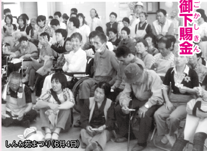
しんわ苑まつり(6月4日)

「霞峯会」は、昭和60年に設立後、障害者支援施設「しんわ苑」を開設、萩で初めて「障害者グループホーム」、就労支援施設「夢香房すさ」を運営しています。