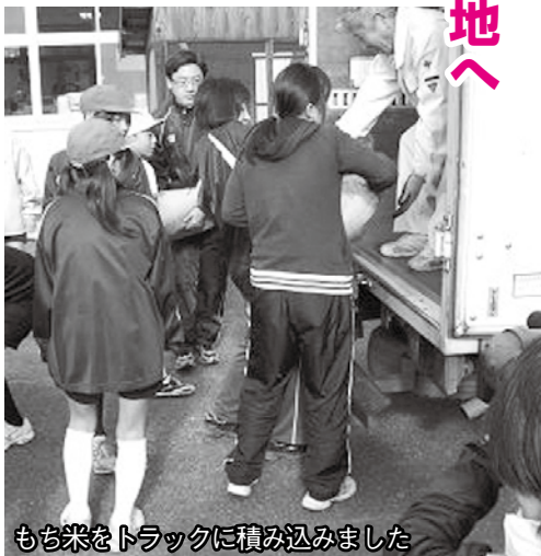
もち米をトラックに積み込みました

校ではメッセージ入りの絵はがきやすごろくを、大島小学校と椿東小学校では励ましのメッセージを被災地の学校へ送っています。