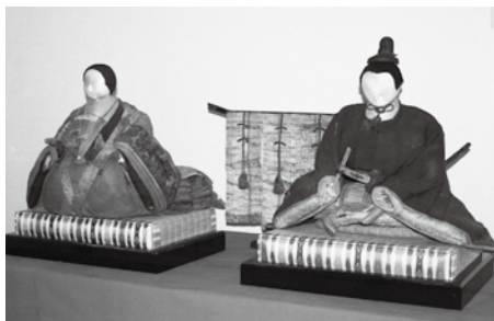
高杉家に伝わるひな人形

行います。 ■とき 2月4日(土) 午前10時~午後4時 ■相談受付電話番号 0120・003・821