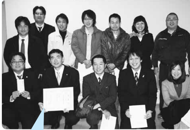
「萩を訪れる観光客に、昼間とは違った夜のおもむきを楽しんでいただきたい」