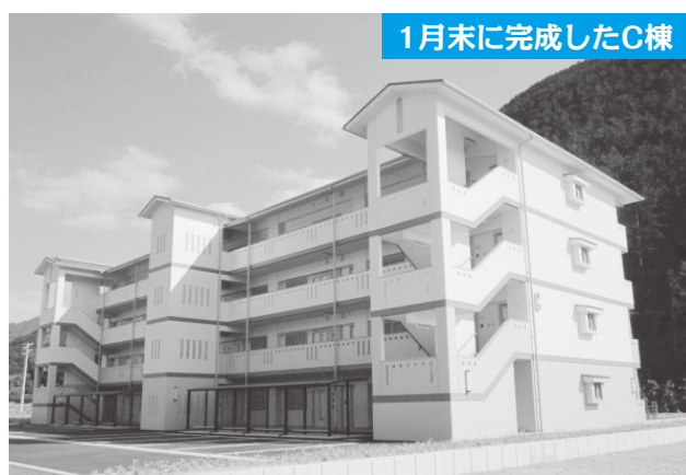
1月末に完成したC棟

戸と福祉複合施設「おとずれ」が完成しています。24年度から事業着手するD棟では、新保育園を合築して整備を行います。