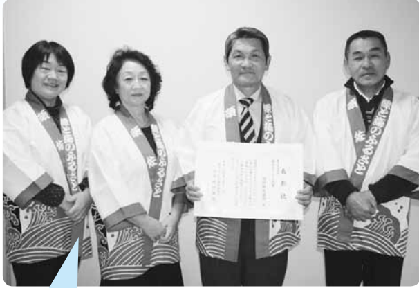
「須佐地域の資源・食・人を生かし、子どもたちが親を誘って来てもらえるようにしたい」