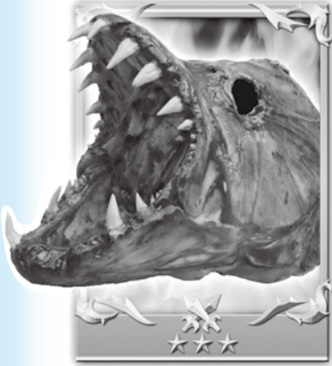
アフリカ最強の「殺人魚」(!?) ムベンガ