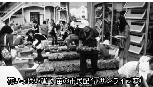
花いっぱい運動 苗の市民配布(サンライフ萩)