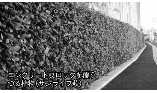
コンクリートブロックを覆うつる植物(サンライフ萩)