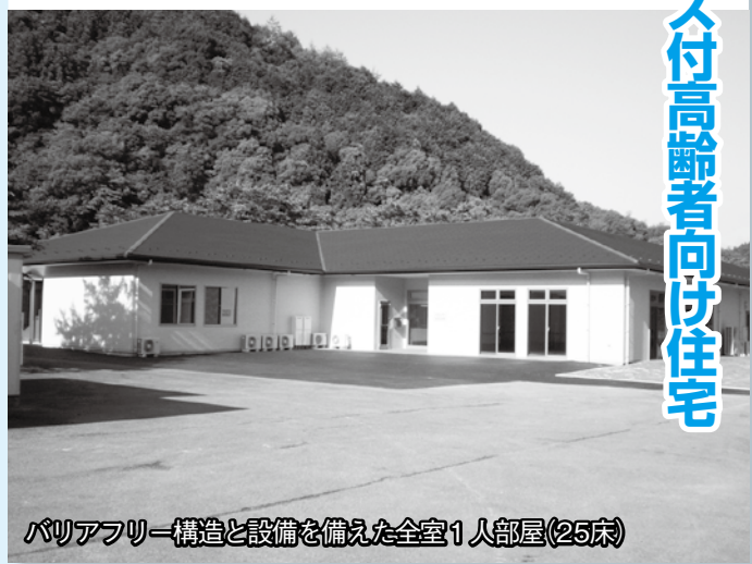
バリアフリー構造と設備を備えた全室1人部屋(25床)