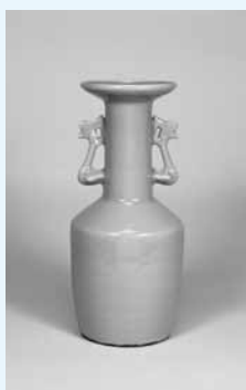
重要文化財「青磁鳳凰耳瓶」 南宗時代 13世紀