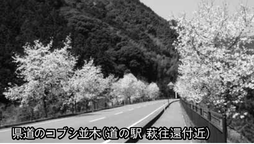
県道のコブシ並木(道の駅 萩往還付近)