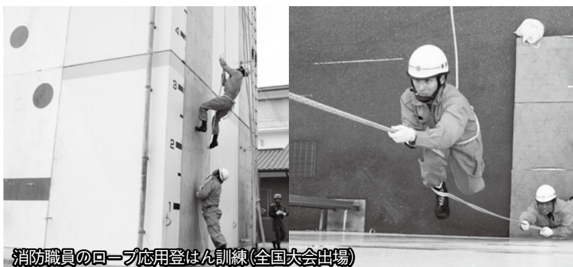
消防職員のロープ応用登はん訓練(全国大会出場)

※すべての職種で、萩市内に居住できる方に限ります。 満年齢は平成25年4月1日現在の年齢です。