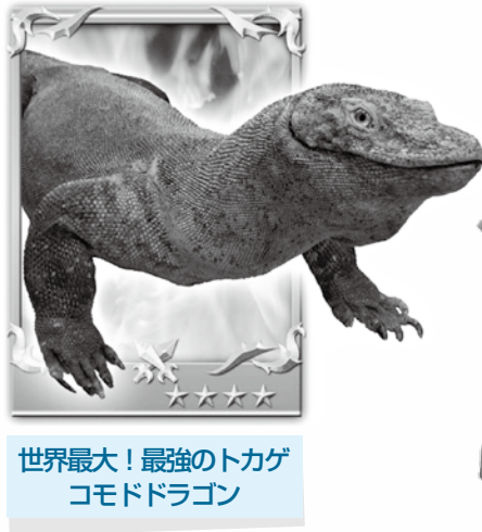
世界最大!最強のトカゲ コモドドラゴン