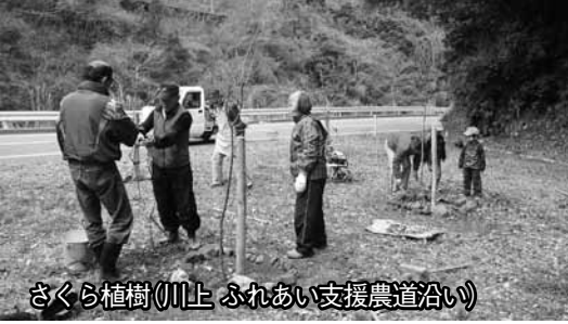
さくら植樹(川上 ふれあい支援農道沿い)