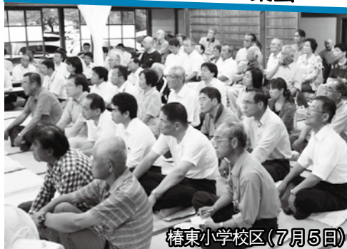
椿東小学校区(7月5日)