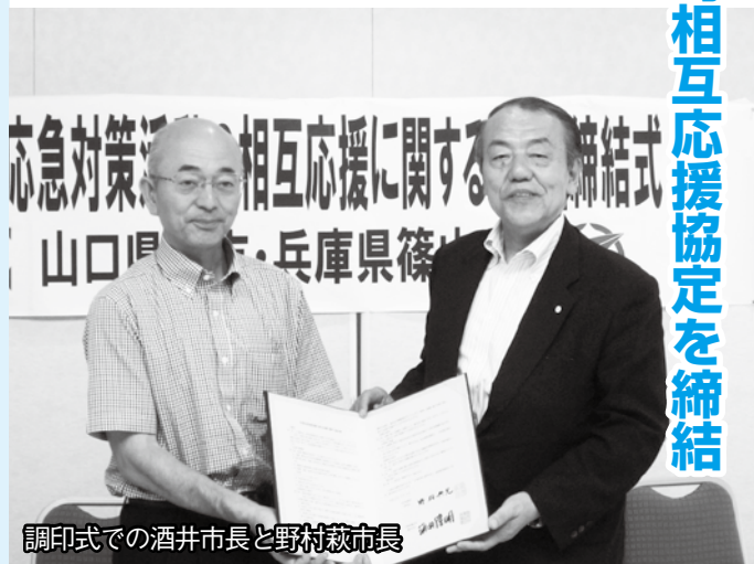
調印式での酒井市長と野村萩市長

協定の締結により、いずれかの市で災害が発生した場合、食糧や物資の供給、職員派遣、児童生徒の受け入れ等において相互に応援・協力をします。