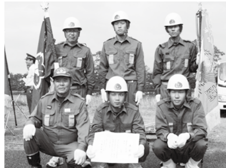
基本操法：小型ポンプの部 大島分団 A

次の各種目の1位は、9月15日に山口市で行われる「山口県消防操法大会」に萩市の代表として出場します。