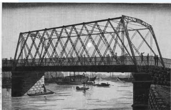
井上安治「霊岸島高橋の景」 明治14年(1881) 神奈川県立歴史博物館蔵