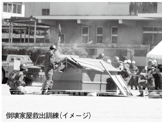
倒壊家屋救出訓練(イメージ)