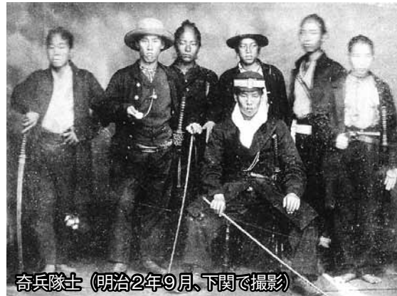
奇兵隊士(明治2年9月、下関で撮影)

■ 問い合わせ 観光課(25・3139) ■ 問い合わせ 観光課(25・3139)