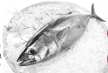
ヨコワ▶ (クロマグロの若魚 で3~5kgサイズ)