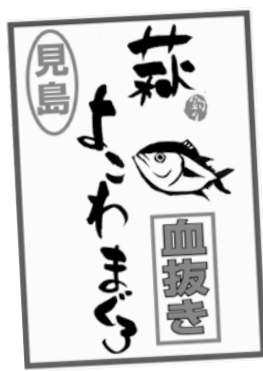
ラベルを付けて販売