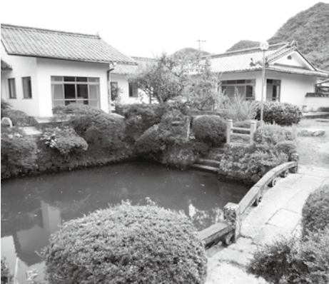
平安古かいまがり交流館

旧見玉家屋敷跡を改修し、まちじゅう博物館のサテライトとして整備。10月20日「萩まちじゅう博物館構想」策定から10年を記念してシンポジウムを開催