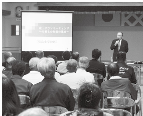
萩タウンミーティング（見島）