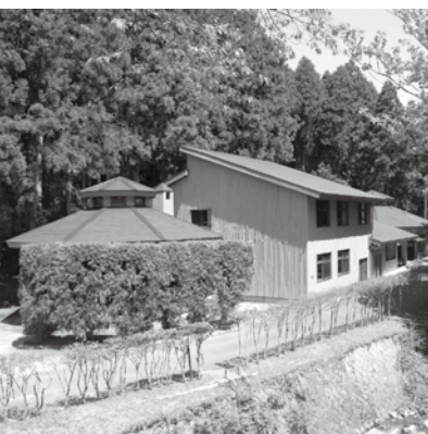
萩往還夏木原交流施設

県から譲渡を受けた旧21世紀の森・夏木原キャンプ場を改修し、「萩往還」の休憩施設としてオープン