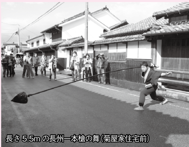
長さ 5.5m の長州一本槍の舞(菊屋家住宅前)

でしたが昼前に雨もあがり、午後には中央公園から金谷神社を目指して、古萩町大名行列、平安古備組をはじめとする「時代パレード」が行われました。雨のため中止となった団体もありましたが、4万2000人の人出で賑わい、各地で江戸時代にタイムスリップしたかのような歴史絵巻が展開されました。来年は奇兵隊結成150年を迎えることから、今年は奇兵隊ゆかりの地である下関市と萩市の連携イベントの第1弾として、下関市民ミュージカルの会の皆さんが参加。奇兵隊に扮したミュージカルでまつりに華を添えました。