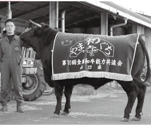
全国和牛能力共進会に出場

5年に1度開催される和牛の全国品評会で山口県代表として出場した「紫北浦3号」が優等賞に入賞