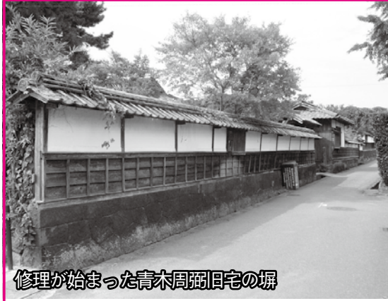
修理が始まった青木周弼旧宅の塀