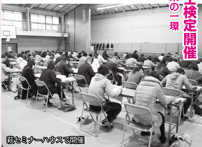
萩セミナーハウスで開催

昨年まで同時開催されていた子どもものしり博士検定は、今回から市内各小学校5・6年生がふるさと学習の一環として勉強し、11月26日から1月中旬までの間、授業中に検定に挑戦します(受検予定者数798人)。