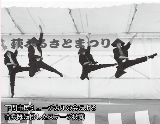
下関市民ミュージカルの会による 奇兵隊に扮したステージ披露