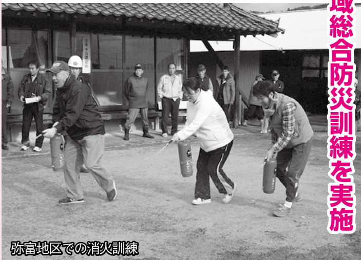
弥富地区での消火訓練

災害に備えて 須佐地域総合防災訓練を実施 11月18日、萩市沖を震源とした大規模な地震・津波の発生を想定した須佐地域の総合防災訓練を行い、地区住民145人のほか消防団員、市職員など合計297人が参加しました。 須佐地域では旧須佐町の平成10年から総合防災訓練を実施しています。 今回は、避難訓練のほか消火器の使用やケガの応急手当の講習などを行い、須佐地区の避難訓練では、昨年発足した本町河原丁地区の自主防災部が、地区内の声の掛け合いや一時集合場所の確認、非常持ち出し袋を持っての避難などを行いました。