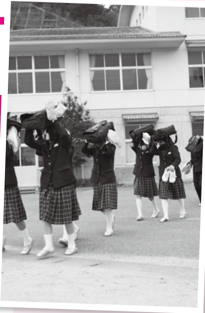
越ヶ浜中学校の避難訓練