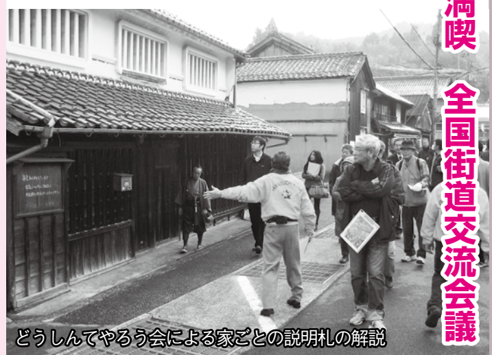
どうしんてやるう会による家ごとの説明札の解説

講演会では「家ごと」に説明札を掲げ、地域ぐるみで町並みに魅力を加えようとしている、「田園や山々の中に残る赤瓦の町並みは貴重な観光資源となる」などの意見がありました。