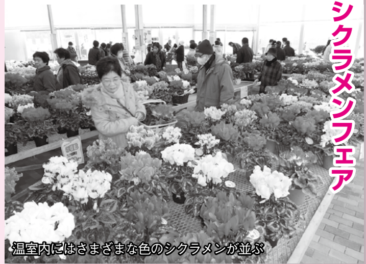
温室にはさまざまな色のシクラメンが並び

主催者の福栄鉢物生産組合によると「今年は秋の高温で管理が大変だったが丹精込めて育てました」とのこと。お気に入りのシクラメンを見つけられただけの笑顔が印象的でした。