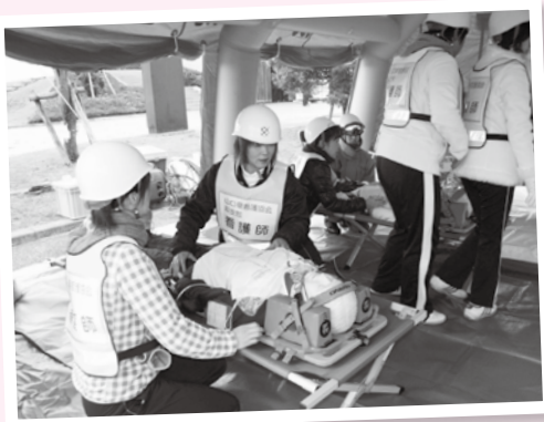
看護協会による救護所での応急手当

12月1日、萩港多目的広場（マリーナ萩付近）をメイン会場に、厳しい寒さの中で萩市総合防災訓練を行い、越ヶ浜・後小畑地区住民、越ヶ浜中学校、消防団、越ヶ浜女性防火クラブ、防災機関など約550人が参加しました。