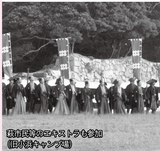
萩市民等のエキストラも参加 (旧小浜キャンプ場)