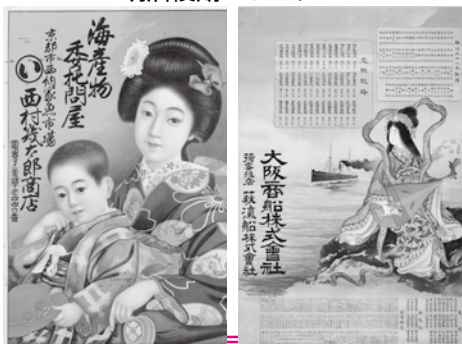
明治後期のポスター