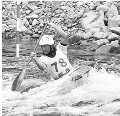
阿武川特設カヌー競技場

「日本カヌーワールドウオーター選手権大会、カヌースラロームジャパンカップ最終戦」で萩市在住の選手3人が優勝するなど上位に入賞